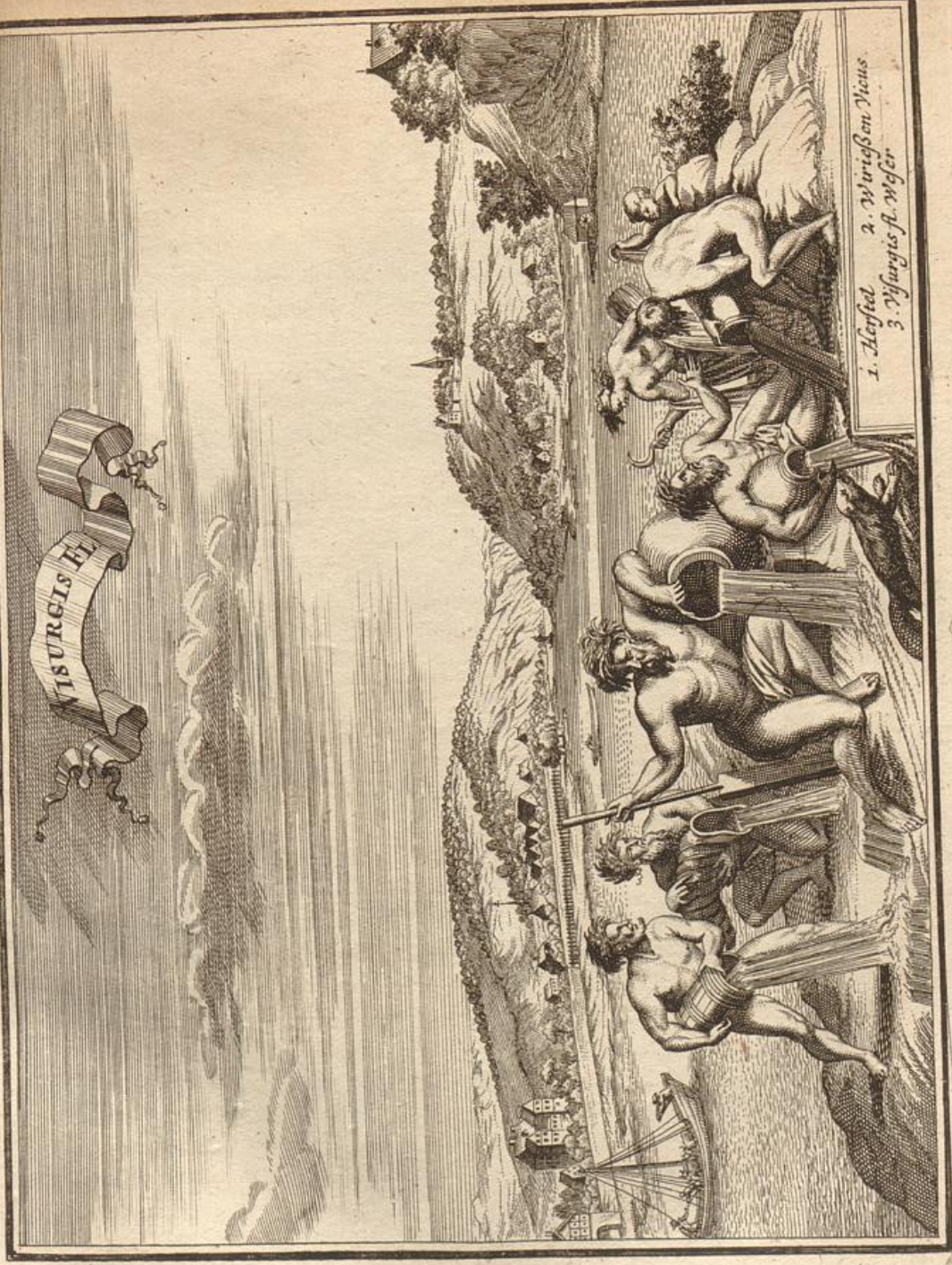
1. Herfald 2. Wriggen Nios 3. Myrgis fl. wger