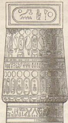
Geschlossenes Kapitäl des grossen Tempels von Karnak.

Eine besondere Gliederung (etwa jenem Palmenkapitäl von Soleb und von Sesse entsprechend) hat dies Kapitäl des geöffneten Kelches nicht; dagegen hat es, die Aussenseite seines mächtigen Kraters umgebend, eine Verzierung in der Art feiner Schilfblätter, aus denen sich zarte Blütenstengel erheben. Unter dem Kapitäl ist der Säulenschaft mit mehreren Bändern oder Ringen (einer Reminiscenz der alten Form) umgeben. Im Uebrigen haben sämtliche Säulen auch an ihrem unteren Theile die übliche Schilfblattverzierung. Weiter aber ist von dem Ursprunge und der Bedeutung ihrer Form keine Bezeichnung mehr zurückgeblieben: sie sind, ohne alle weitere architektonische oder bildnerische Gliederung, zur völlig compacten architektonischen Masse geworden. Wenn hienach dem neuerscheinenden Kapitäle des geöffneten Kelches eine gewisse grossartige Majestät in der allgemeinen Wirkung keineswegs abzusprechen ist, so verliert alles Uebrige seine Bedeutung im architektonischen Sinne: die Säulenschäfte