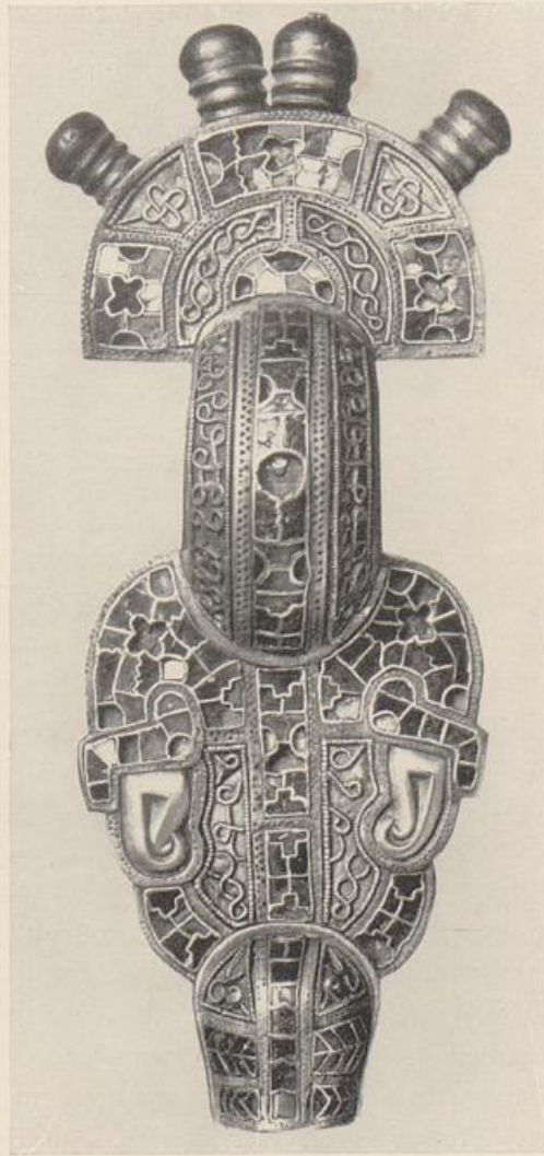
4. Wittislinger Sibel.

viel roher als die gotländische, aber nicht einmal sie ist ohne römische Provinzkunst denkbar. Und – es wird nichts erzählt! Bei den Südgermanen, bei den Ahnen der Deutschen also, darf man vollends feststellen, daß „Lied und Bild“ zur karolingischen Zeit überhaupt noch nicht zusammengetroffen waren. Dafür aber läßt sich etwas anderes beweisen: die deutsche Kunst, einem Boden und einem Blute entsprossen, denen (wie etwa die stillschöne Wittislinger Sibel zeigt) die hochentwickelte Linienpolyphonie