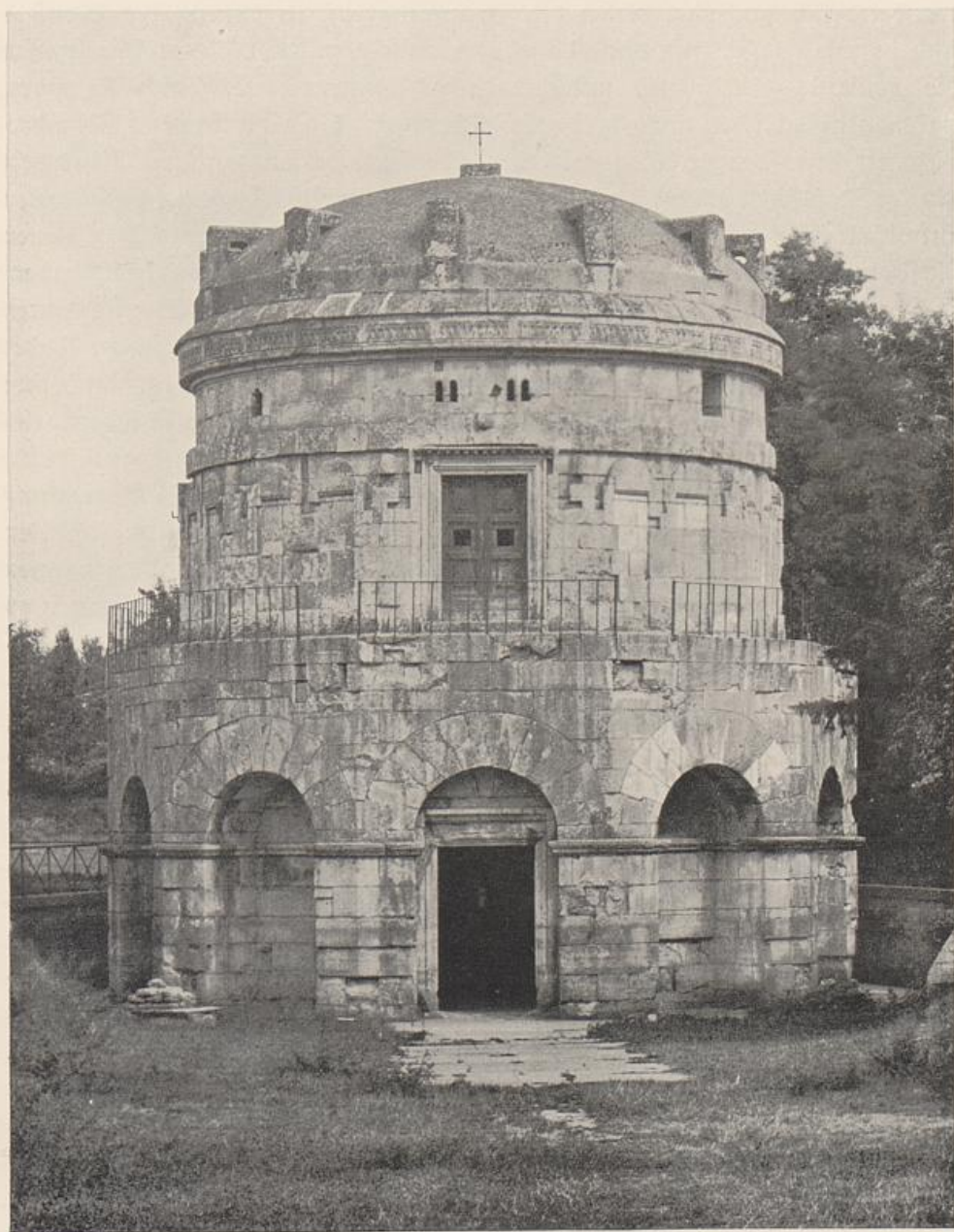
2. Ravenna, Grabmal des Theoderich