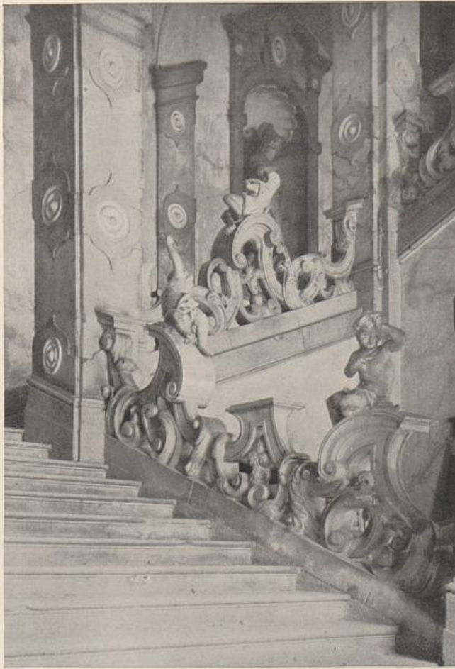
5. Salzburg. Treppe von Schloß Mirabell

formen der Stufen selber. Und, das Schauspiel zu vollenden: Putten werden hinaufgeschaukelt, Putten, die es gewiß nicht gäbe ohne die Berührung mit Italien, die es vor allem nicht geben konnte ohne eine lange Eroberung der plastischen Form, die nun längst erworben und ins Malerische hinübergetaucht ist. Buchstäblich: die bewältigte Erscheinungswelt ist von den alten Bewegungsströmen auf den Rücken ihrer Wogenkämme genommen worden. Der Grundgedanke der tätigen Bewegung ist das Tragende. Alles andere ist darin nur aufgenommen, nenne man es ruhig „Ausgeburt“. Und würde man in die Mitte des Zeitabstandes zwischen Wikingerornament und Mirabelltreppe einschneiden – man träfe bei uns (und nirgends sonst)