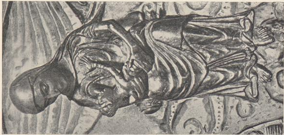
71. Ewa, Silberstein. Bronzetür