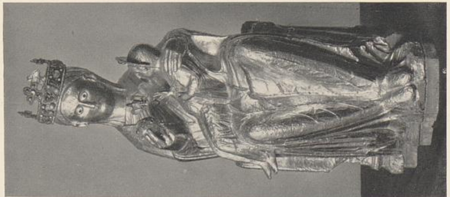
70. Madonna, Effen, Münsterisches