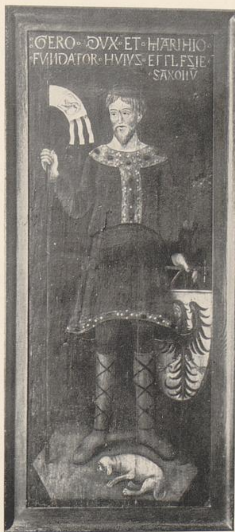
69. Gero-Grabmal aus St. Cyriacus Gernrode (nach späterem Gemälde)

11. Jahrhunderts, vielleicht also auch schon früher. Zugleich dürfen wir in jenem Gero-Grabmal sehr deutlich den Vorläufer des bekannten Wiprecht von Groitzsch (um 1230) erkennen. Was die Merseburger Bronzeplatte so lehrreich macht, so überzeugend einmal für den anderen Altersstand der Plastik – zur Zeit, als der zweite Speyerer Dom wohl schon begonnen war! –, dann aber für einen aufsteigenden Willen zu späterer Größe, das ist die Begegnung von Bild und Relief in nun fast lebensgroßem Maßstabe. Die ganze Platte ist fast zwei Meter