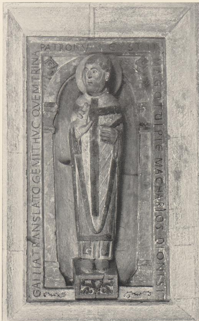
75. St. Dionys. Regensburg, St. Emmeram