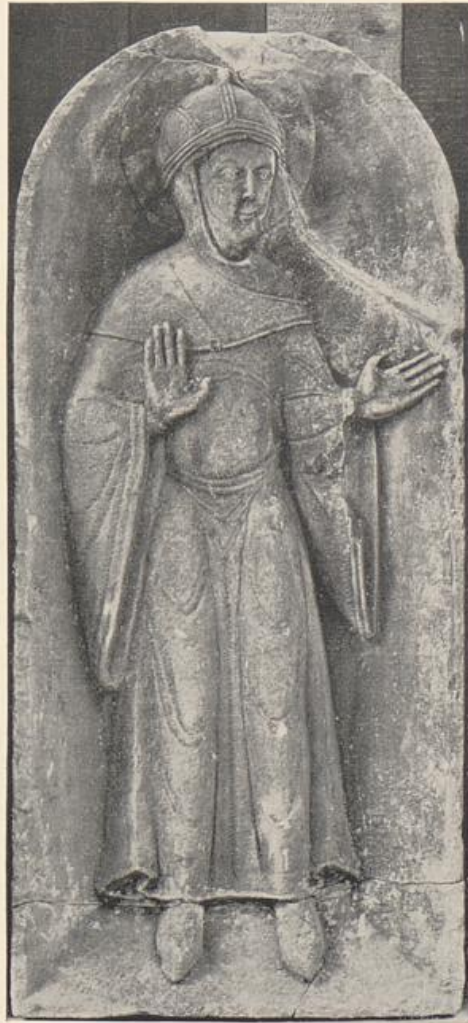
66. Figur aus St. Mauritius. Münster, Landesmuseum

Baukunst, dann war sie als solcher echter, und dann standen ihr, namentlich in stauffischer Zeit, auch große Aufgaben bereit, dann war sie echt als Stil, aber das hieß auch, daß sie nicht malerisch war. Oder sie war malerisch, dann lag sie noch im Banne der Spätantike. Die Bekämpfung dieses Bannes konnte eine Zeitlang das Malen selber unsicher machen.