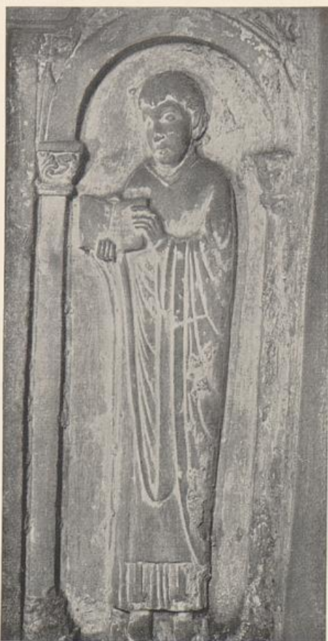
67. Diakon aus der Abteikirche in Werden

malerischen Grundhaltung des Sehens, auch wo der Steinbildhauer die Form verwirklichte. Man braucht noch gar nicht nach Byzantinischem auszuschaun. Es genügt ein Blick auf spätrömische Grabsteine wie jenen des Valerius Priscus im Wiesbadener Museum (2. Jahrhundert nach Christus), um die Herkunft aus dem spätantiken „Raumillusionismus“ festzustellen. Der wannenartig zurückgewellte Grund ist nicht in seiner tastbaren Härte gemeint, in seiner Wirklichkeit, sondern unwirklich, mit einer nur dem Auge fassbaren Bedeutung, als Vertreter des Raumes, schattenfangend und die Gestalt als Bild in sich aufnehmend. Die Säule „hängen“ nicht (häufig werden sie so missverstanden, auch bei späteren französischen Säulenfiguren wie denen von Chartres kommt das vor), sondern sie sind perspektivisch, in Aufsicht, von oben gesehen. Auch ihr Fußboden steigt dem Sinne nach nicht in Wirklichkeit, sondern er „flieht“, er verjüngt sich für das Auge. Die Ge-