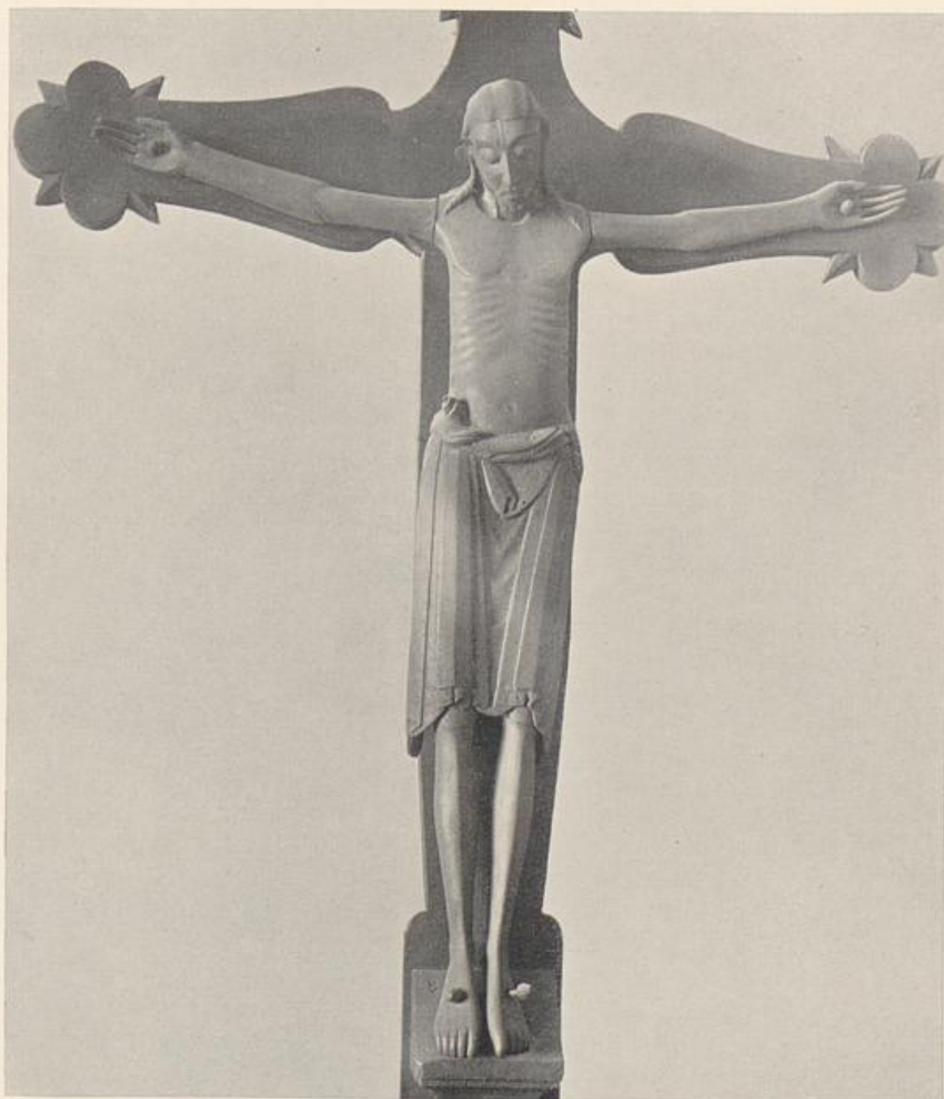
74. Kreuzifirius. Werden, Abteikirche

In der letzten salischen, der Zeit Heinrichs V. (1106–1125) scheinen zwei größere Werke das Wesen des Zeitalters abschließend und in Gegensätzlichkeit zusammenfassen zu wollen: das schwerfällig wuchtige Relief der Externsteine und das adelig schöne Heilige Grab von Gernrode. Daß der Meister der Externsteine aus Westfrankreich gekommen sei, ist eine reichlich unbewiesene Vermutung. Die Bewegungsformen lassen sich vielmehr sehr deutlich von Roger von Selmarshausen (Abb. 84) ableiten. Dieser war für eben das Kloster Abdinghof tätig, dessen Mönche das Relief der Externsteine schufen. Sicher ist, daß wir es mit der Vergrößerung einer Kleinplastik