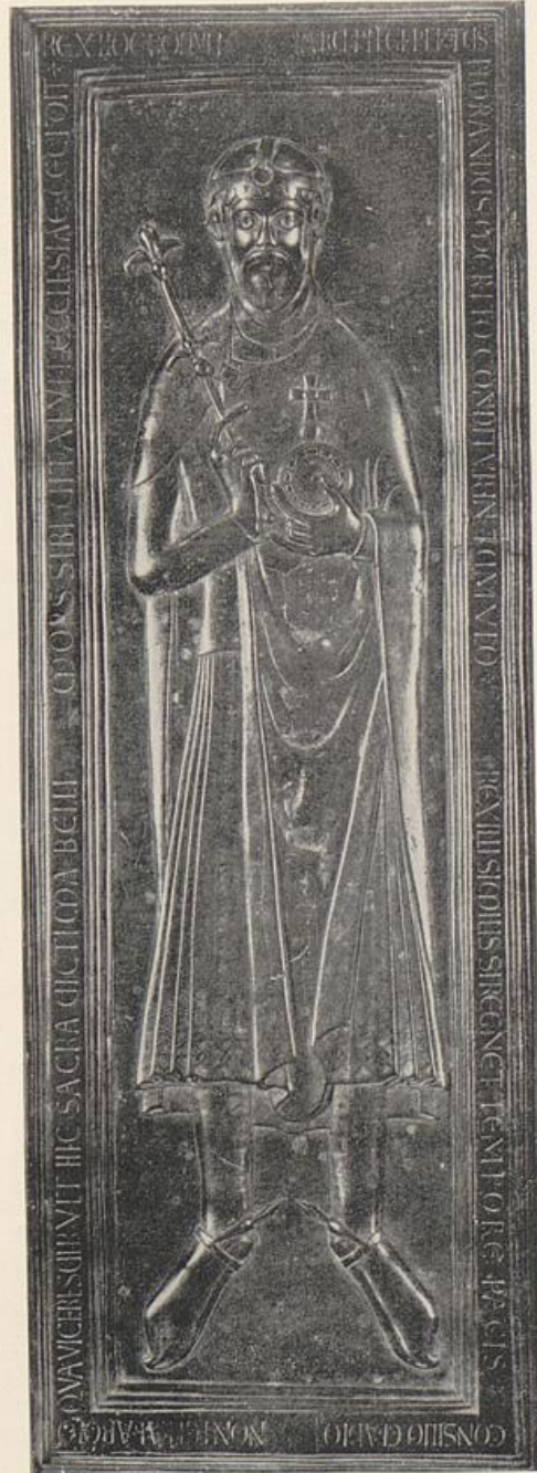
68. Grabmal Rudolfs von Schwaben im Dom zu Merseburg

halb nachzeichnen sollte, aber nicht sie hinstellen und umgreifen im Auftrage eines ebenbürtigen Tastgefühles und als nur verlängerter Tastsinn. Ähnliches darf von den Kantener Ritterreliefs (Michaelskapelle beim Dome) gelten, sowie von verschiedenen Relieffiguren der Abteikirche zu Werden und ihrer Krypta. Unter ihnen sind zwei (nur 67 cm große) Reliefs mit stehenden Diakonen, heute hinter dem Hochaltare vermauert, besonders hervorzuheben. Sie stammen gleich den anderen aus der Zeit des Bischofs Adalwig (bis 1080, also echte Zeit Heinrichs IV.). Es ist eigentlich nicht recht einzusehen, warum zwischen Franzosen und Italienern heute noch ein so verzweifelter Streit – von dem Amerikaner Kingsley Porter mit überlegener Ironie verfolgt und abgeurteilt – über den Vorrang von Modena oder Moissac-Toulouse (nahe an 1100) tobt. Die vielgenannten Figuren des Kreuzganges von Moissac sind auch nicht weiter, nur zeichnerisch etwas schärfer als die Plastik von Werden, die Jahrzehnte älter ist. Freilich wird man auch von dieser sagen können: sie ist nicht echte Plastik, sondern hochgewelltes Bild. – Dies gilt namentlich auch von den Grabmälern des späteren 11. Jahrhunderts. Man darf sich vor ihnen daran erinnern, daß es auch völlig flache Grabplatten in Mosaik gibt und daß solche einstmals den plastisch gearbeiteten Grabmälern vorange-