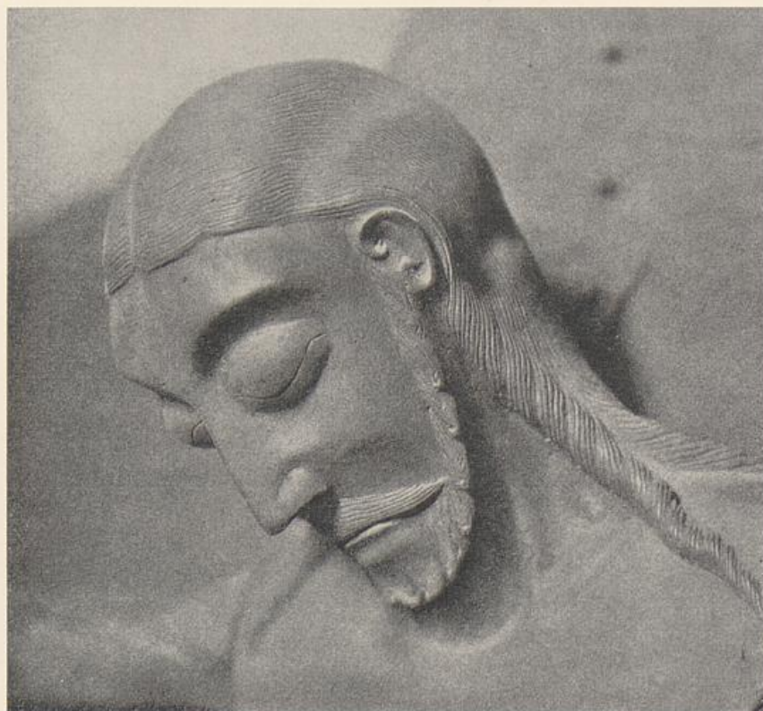
76. Kopf des Verdener Kreuzifixus

lena erscheint, ist „reichenauisch“ gesehen, wie die Aufwellung eines Bildes zum Relief. Auch Maria liegt noch im Banne des Spätantik-Ottonischen. Aber bei ihr ist namentlich der Unterkörper, ist insbesondere die geradere Stellung der Füße, der Verzicht auf das perspektivisch gemeinte „Hängen“ doch ein großer Schritt nach vorwärts. Zugleich herrscht hier ein heiliger Ernst, eine Sagekraft der still sprechenden Mänder, der beredten Hände, namentlich des wie aus Himmelstiefen kommenden raumerobernden Blickes, daß wir diese spätsalischen Leistungen zu den größten unserer ganzen älteren Kunst zählen dürfen. Die größte Überraschung bot der Fund eines Bischofskopfes, der offenbar zu einer Figur des heiligen Metronus gehört. Hätten wir nichts als ihn – wir wüßten, daß in jenem geschichtlich großen Zeitalter sehr große Kunst möglich war. Das ist, trotz nachklingendem Spätottonischen in den riesigen Augen, echte Archaisk. Man zeige uns doch einen ebenbürtigen Kopf aus der ganzen gleichzeitigen Plastik des übrigen