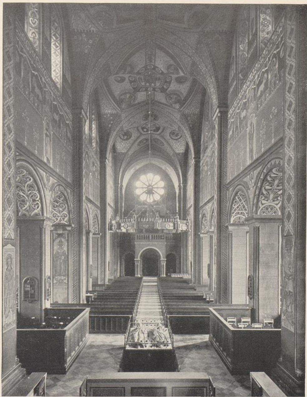
ss. Dom zu Braunschweig