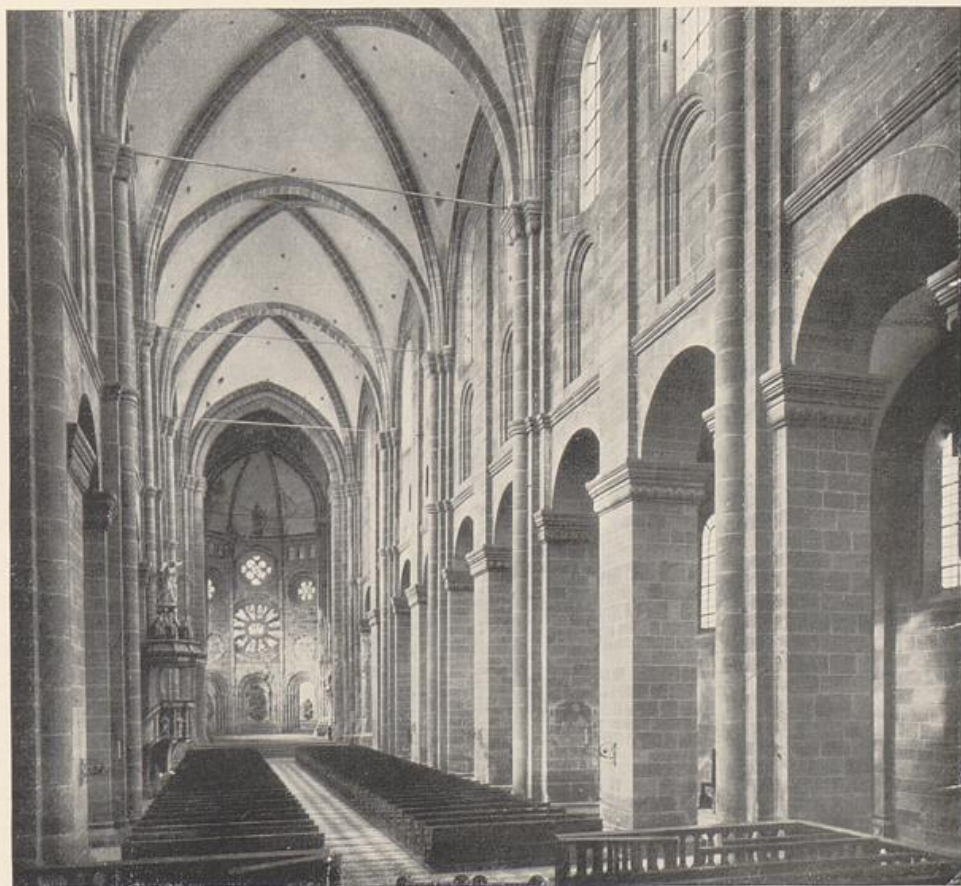
90. Dom zu Worms

wandtschaft mit der Ostseite von Murbach zu erkennen – steht seit der spätaufischen Bauzeit der vieleckig vorbrechende Raumkörper des Westchores gegenüber. Doppelhörigkeit: das Verbotenste, das seit vielen Jahren Überwundene für den französischen Gotiker! Nur im Osten ein Querschiff. Sechsmal schießen Turmkörper empor, vier von ihnen, der östliche Vierungsturm und die drei des späteren Westchores, von Zwerggalerien durchbrochen. Der ganze Bau mit einem Blendsystem von Bogen überflochten, das in größter Feinfühligkeit sich mit den Höhenlagen verkleinert und verschnellert: ein „romantischer“ Bau durchaus zur Zeit der zum Höchsten entwickelten französischen Gotik! Ein deutscher Bau in Wahrheit, der uns das wahre Gesicht unseres Volkes zeigt, so wie sein Äußeres wahrhaft das Gesicht des Inneren ist. In diesem ist das Wissen um Speyer und Mainz