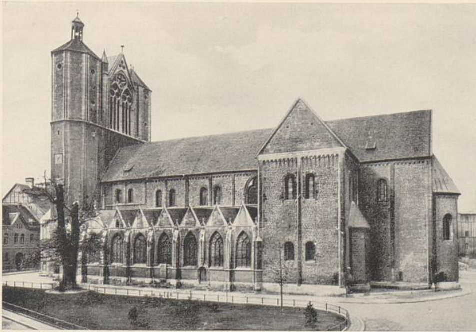
87. Dom zu Braunschweig. Um 1180

lichen Sinne stauferische Kunst. Nur in der großen Baukunst glauben wir einmal beide Gestalten, wie zu Architektur geworden, in einer Art dramatischer Gegenrede zu sehen.