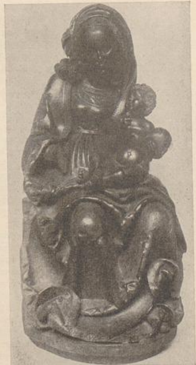
458. Meister Paul, Madonna. Danzig, Museum.

weich-breiten Körpergefühl (im nackten Oberkörper Christi) in einem Relief der Ny Carlsberg Glyptotek, Kopenhagen. Nach der Rückkehr aus Dänemark (1532) hat Berg die Güstrower Apostel geschaffen: leidenschaftliche Figuren (Joseph hat zuerst bei uns auf sie aufmerksam gemacht), in denen aber eine merkwürdig landsknechtische Derbheit durchbricht. Unter den Nachfolge- und Werkstattarbeiten seien besonders der Wittstocker Hochaltar, der Altar von Lanken und — von sehr hohem Niveau und selbständigem Geiste — der von Birket in Dänemark genannt. — Bergs Kunst tritt in Lübeck mit einer jähen Plötzlichkeit auf; sie ist nicht die Steigerung der Art Hennings von der Heide (den Berg kannte, dem er sein Haus verkaufte), sie ist wirklich Einbruch eines Neuen. In diesem Falle ganz sicher: süddeutscher Kunst. Berg muß in Oberdeutschland gearbeitet haben, und Thorlacius-Ussing hat richtig gesehen: Veit Stoß ist unter den mannigfach anregenden Eindrücken der stärkste gewesen. Daß daraus Bergs eigener, ungemein ausdrucksvoller Stil sich bildete, ist, wie immer, persönlichste Leistung. Es ist zugleich Ausdruck für die überpersönliche Macht von Zeitströmungen. Durch Berg fließt die allgemeine deutsche Bewegung ungehemmt und erfährt so den Kreis der deutschen (nach Deckert: „lübisch-baltischen“) Küstenkunst.