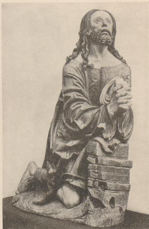
451. „Meister von Rabenden“, Ölbergfigur. Berlin, Kaiser Friedr.-Museum. (Nach Feulner.)