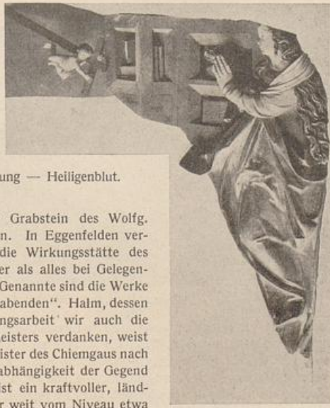
453. Verkündigung — Heiligenblut.