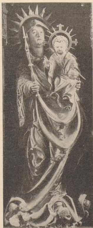
443. Hans Leinberger, Madonna vom Moosburger Altar. (Nach Feulner.)