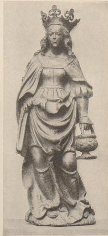
450. „Matthäus Kreniss“. Weibliche Heilige, Berlin, Kaiser Friedr.-Museum.