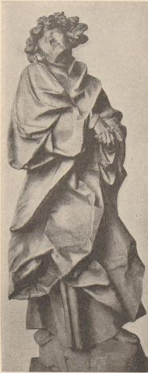
455. Johannes von Vindinge. (Nach Marburger Jahrbuch.)

Altar, sein Allerheiligenbild, Raffaels Transfiguration in neuer Form für Europa hingestellt hatten. Eine malerische Vision aus plastischen Gestalten. Diese Gestaltenschichten verkleinern sich durch drei Geschosse, um erst im obersten, in der (auch gedanklichen) Krönung größeren Maßstab wieder zu gewinnen. Auch dieser Weg der Maßstäbe ist barockes Formideal: ein Sich-höher-kämpfen, um im Finale frei zu schweben; das Höchste als Ergebnis, der Ablauf als Leistung. Diese ganze, selbst fast protestlerisch auftrumpfende Welt aber ist aus Gestalten von derbem, schwer untersetztem Kerne, erweitert in wogenden Gewändern, zusammengedichtet; sie ist ausgesprochener Frühbarock. Am stärksten in den unteren Zonen. In der Königsfamilie ist die innere Erdschwere am deutlichsten. In der obersten Sphäre, wo die höchsten Orgeltöne gegriffen werden sollen, nähern sich die Gestalten manieristischer Biegsamkeit: sie beginnen, Ausdruckslinien zu dienen, statt sie aus sich hervor zu treiben. Es ist Bergs