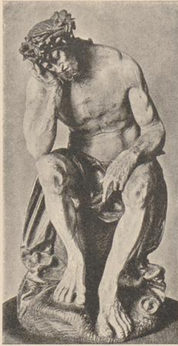
448. Hans Leinberger, Christus in der Rast. Berlin, Kaiser Friedr.-Museum.