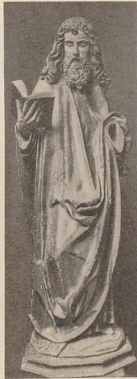
438. Elsässischer Heiliger. (Nach Schmitt.)

Zwei ausgezeichnete Figuren der oberhessischen Klosterkirche von Hirzenhain, wohl sicher dem zweiten Jahrzehnt angehörig, Baptista und Antonius (Marburger Jahrb. II, Abb. 83–85) und zwei Elsässische Heilige des K. F. M. (Schmitt, Oberrhein. Sk. 71). Die Hirzenhainer, Arbeiten eines sonst wohl nicht festzustellenden, ungewöhnlich stark empfindenden Meisters (ein Johannes des Darmstädter Museums kann späteres Werk, kann auch Nachfolge sein), mögen auf den ersten Blick eher als Parallele zu Stoß erscheinen. Die Stellung des Johannes ist tatsächlich echt spätgotisch (Erinnerung an den Stil der Verschränkung), die des Antonius in den ruhigeren Formen echter Spätgotik noch nicht undenkbar. Aber das innere Erlebnis, die Einfühlung des Meisters in das Wesen der Gestalt, wie in einen lebendigen Menschen, ist von der gleichen seelischen Monumentalität wie beim Isenheimer. Und nun das Gewand: es setzt sich in eine, außen sich vollziehende Eigenbewegung, es rollt sich, fängt sich, schäumt. Und schließlich begreift man, daß auch