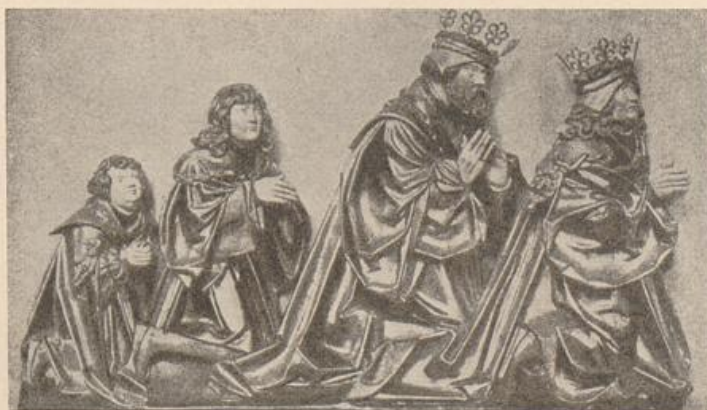
454. Claus Berg, vom Odenser Altar.

Figuren, die in Bayern anzutreffen man sich nicht wundern würde. Das Höchste — sicher nicht von gleicher Hand wie die Schreinfiguren — sind die Gestalten der Verkündigung. Wunderbar kompakt, ganz unbeschreiblich lebendig durchgeföhlt und in einer sehr maßvollen Andeutung barocker Gewandung weitergeföhrt. Mit der üblichen steirisch-kärntnerischen Barockweise hat dies nichts zu tun. Diese wird am deutlichsten durch den St. Wolfgang-Altar von Grades repräsentiert. Eine enorme Gewandwucherung ist cha-