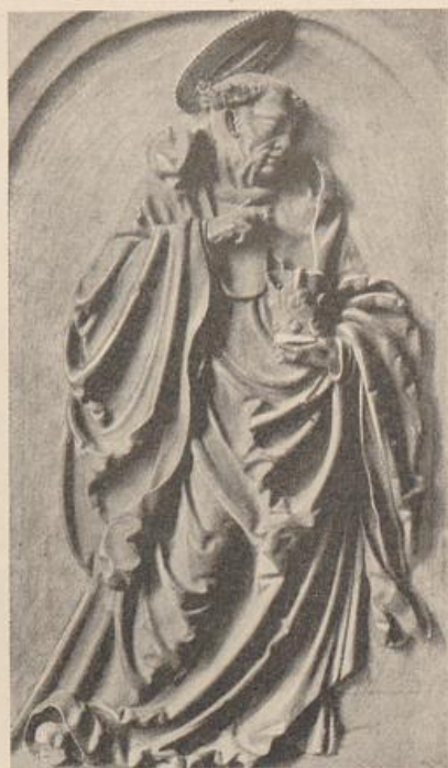
452. Buchsrelief St. Benedikt. Salzburg, St. Peter, Schatzkammer.