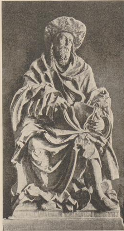
445. Hans Leinberger, Jakobus. München, National-Museum.