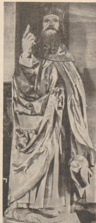
436. Hirzenhain, Hl. Antonius.

typische Vertreter der beiden Stile, die ein entscheidendes Zwischenerlebnis trennt (und ein Abstand von 40 Jahren). Man beachte bei der Landshuterin die starke Vorstellung der Brust, des Bauches, des Beines, — und wie alle Faltenbewegung vom Körper kausal abhängig, an die Ränder des stark vorgestellten Körperlichen verwiesen ist. Die Bewegung umbrandet von außen — bei der Dangolsheimer durchspielt sie die Gestalt. Aber nun sieht man auch, wie abstrakt die menschliche Grazie der älteren Figur in ihrer psychologischen Mehrdeutigkeit ist. Die Majestät der Landshuterin ist gehobene Individualität. Im Psychischen ist nichts anderes gesagt als etwa in den Haaren: wie sie bei dem jüngeren Werke von hoheitsvoll ausmodellierter Stirne in festen