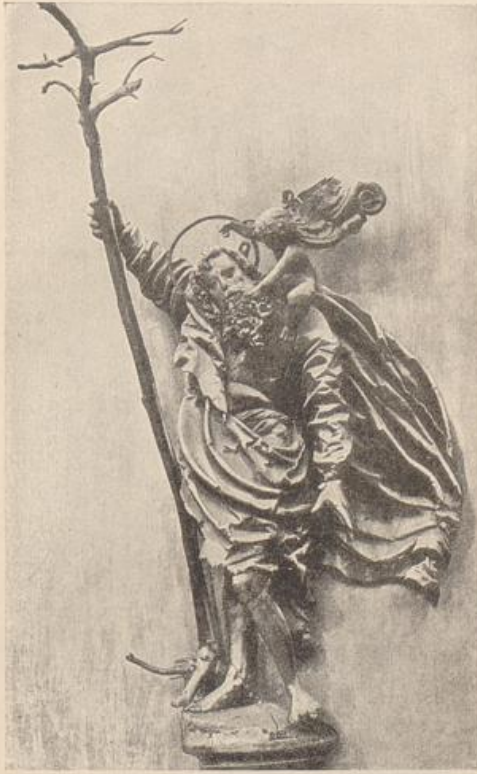
449. Der Rasso-Meister. Christophorus, München.