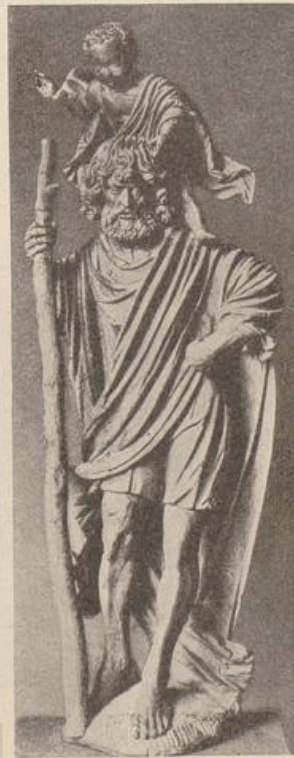
460. Christophorus aus Babenhausen. (Nach Gröber.)