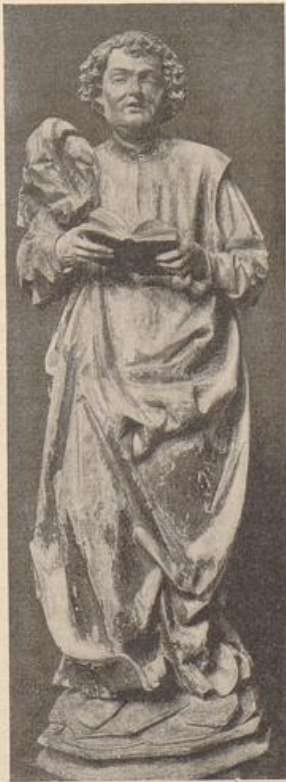
437. Elsässischer Heiliger. (Nach Schmitt, Oberrhein. Skulptur.)

nicht. Auch Lübeck, der Oberrhein, Mitteldeutschland und der Osten, kennen diesen Stil. Da ein erster Begriff von ihm nun feststeht, darf zuvor auf ein paar Beispiele von weniger geklärtem Charakter eingegangen werden.