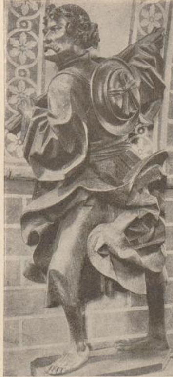
456. Apostel, Güstrow. (Nach Marburger Jahrbuch.)

Altar, sein Allerheiligenbild, Raffaels Transfiguration in neuer Form für Europa hingestellt hatten. Eine malerische Vision aus plastischen Gestalten. Diese Gestaltenschichten verkleinern sich durch drei Geschosse, um erst im obersten, in der (auch gedanklichen) Krönung größeren Maßstab wieder zu gewinnen. Auch dieser Weg der Maßstäbe ist barockes Formideal: ein Sich-höher-kämpfen, um im Finale frei zu schweben; das Höchste als Ergebnis, der Ablauf als Leistung. Diese ganze, selbst fast protestlerisch auftrumpfende Welt aber ist aus Gestalten von derbem, schwer untersetztem Kerne, erweitert in wogenden Gewändern, zusammengedichtet; sie ist ausgesprochener Frühbarock. Am stärksten in den unteren Zonen. In der Königsfamilie ist die innere Erdschwere am deutlichsten. In der obersten Sphäre, wo die höchsten Orgeltöne gegriffen werden sollen, nähern sich die Gestalten manieristischer Biegsamkeit: sie beginnen, Ausdruckslinien zu dienen, statt sie aus sich hervor zu treiben. Es ist Bergs