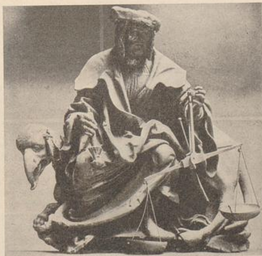
446. Hans Leinberger, Ungerechter Richter. Nürnberg, German. Mus.

Die Bronze-Madonna des K. F. M. trotz kleinen Formates eine Prachtleistung plastischer Phantasie; als Stück selbst durch die Fehler und Zufälle des Gusses von unsäglichem Reize. Die aufgerissenen Endformen wie Krokodilhaut wirkend. Ein unheimlich schwerer Ernst in der Maria; das Kind, sehr klein, wie auf eine Insel heranschwimmend, der Mutter angeborgen. Die herrliche überlebensgroße Madonna von St. Martin (Landshut, s. oben), von majestätisch stolzer Wirkung, muß kurz vor 1519 entstanden sein, also zeitliche Parallele zu Backoffens Gemmingengrabmal, das wohl feiner, aber nicht kraftvoller, ja unlegbar weniger monumental wirkt. Diese Zeit scheint einen besonderen Höhepunkt zu bedeuten: auch der leidenschaftlich gestraffte Kruzifixus an der Südwand des Moosburger Castulus-Münsters und der (vielleicht aus Wasserburgstammende) gewaltige sitzende Jakobus des National-Museums, werden von Bramm um 1518–20 und 1520–23 angesetzt. Der Jakobus wurde als deutsche Parallele (nicht ganz der Qualität, aber durchaus des Stiles) zu Michelangelos Moses schon genannt. Er ist weniger vollplastisch, auch weniger pathetisch-aktiv als der marmorne Gigant, aber für deutsche Begriffe fast ein Unikum an frühbarockem Drang ins Überlebensgroße, von einer süddeutsch abgemilderten „terribilità“.