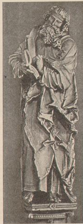
463. Apostel aus dem Halleschen Dome. (Nach Feulner.)