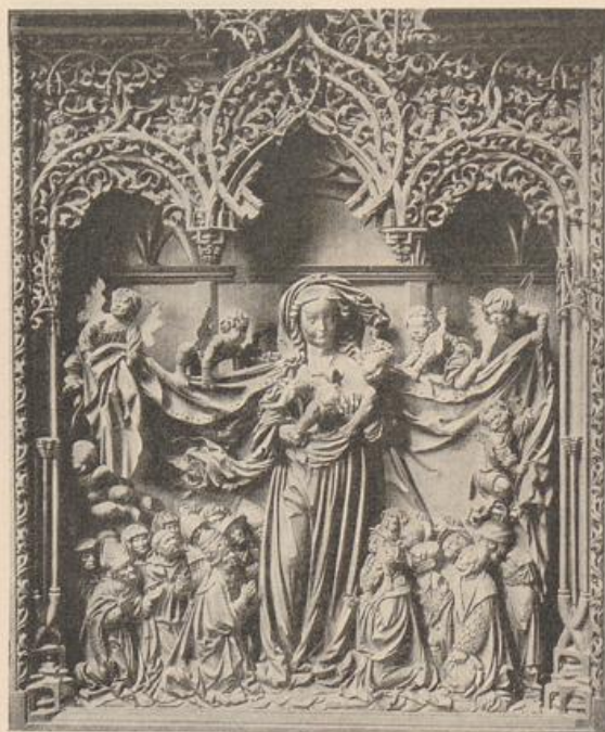
439. Sixt von Stauffen, Locherer Altar, Freiburg i. Br. (Nach Feulner.)

Ein großer Schrein mit unterlebensgroßen Figuren (Schutzmantelmadonna), außen kleinere Einzelfiguren. (Einzelaufnahmen bei Schmitt, Oberrhein. Sk. 136–40.) Dies ist wirklicher Frühbarock. Da der Schutzmantel weit fortgenommen ist, sehen wir geradezu den Kern der neuen Gestaltungsart: er ist ruhig und fest. Wie erst der Mantel mit den Putten die Bewegung bringt, ist hier der Stil fast systematisch doziert. Innen Festigkeit, außen Bewegung. Die Schwellkraft und pralle Gespanntheit, die plastische Saftigkeit der Form triumphiert in den Putten. Es ist sehr wohl möglich, daß die erwähnte Berliner Sebastiansgruppe, ein Wunderwerk deutscher Feinplastik, knapp 10 Jahre später anzusetzen, von diesem Meister stammt. In ihr, namentlich der Hauptfigur (der Sebastian vom Locherer Altare bereitet sie vor) ist die innere Ähnlichkeit mit dem echten Barock des 17. Jahrhunderts bis zum Täuschenden gesteigert. Nicht gleicher Hand, aber gleichen Zeitstiles wie der Locherer Altar, die Madonna von Donaueschingen (vom ehem. H. A., 1522); sonderbarer Weise hat sie große Ähnlichkeit mit einer (derberen) im Halberstädter Dome (Phot. verdankt Verfasser seinem Freunde Alfred Wolters, von dem auch namentlich im ersten Teile wertvolle Hinweise verarbeitet sind).