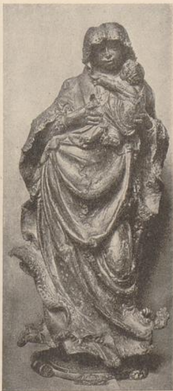
444. Hans Leinberger, Bronze-Madonna. Berlin, Kaiser Friedr.-Museum.