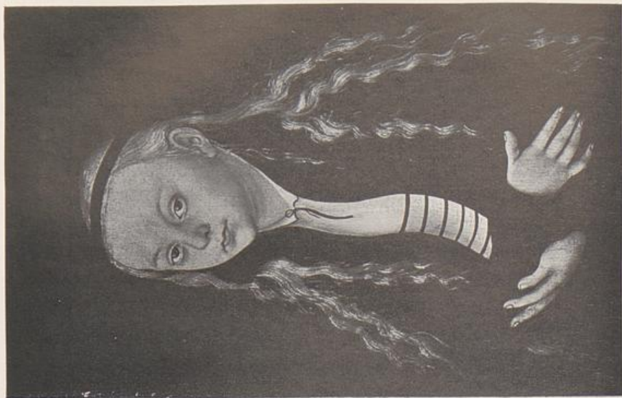
122. Lukas Cranach d. Ä., Sog. Bildnis der Tochter Luthers, Paris, Louvre