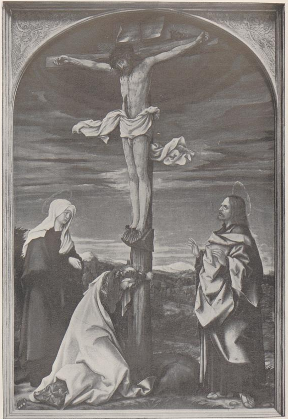
124. Hans Burgkmair, Kreuzigungsaltar, Mittelgruppe, München, Alte Pinakothek