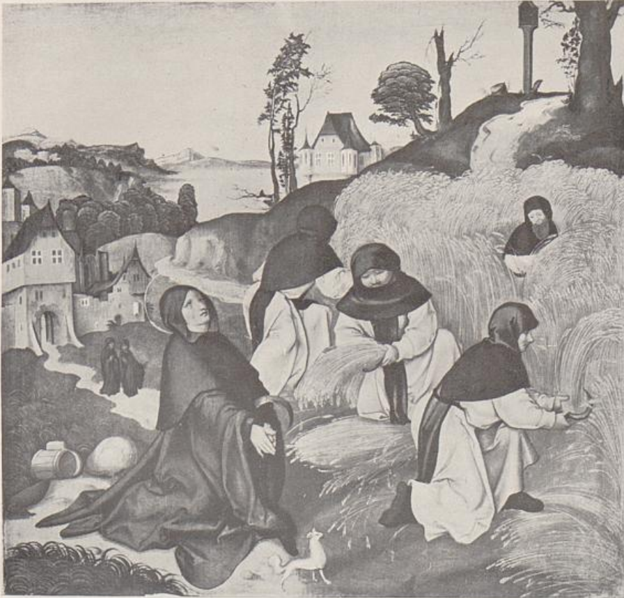
123. Jörg Breu d. Ä., St. Bernhard bei der Ernte, Zwettl