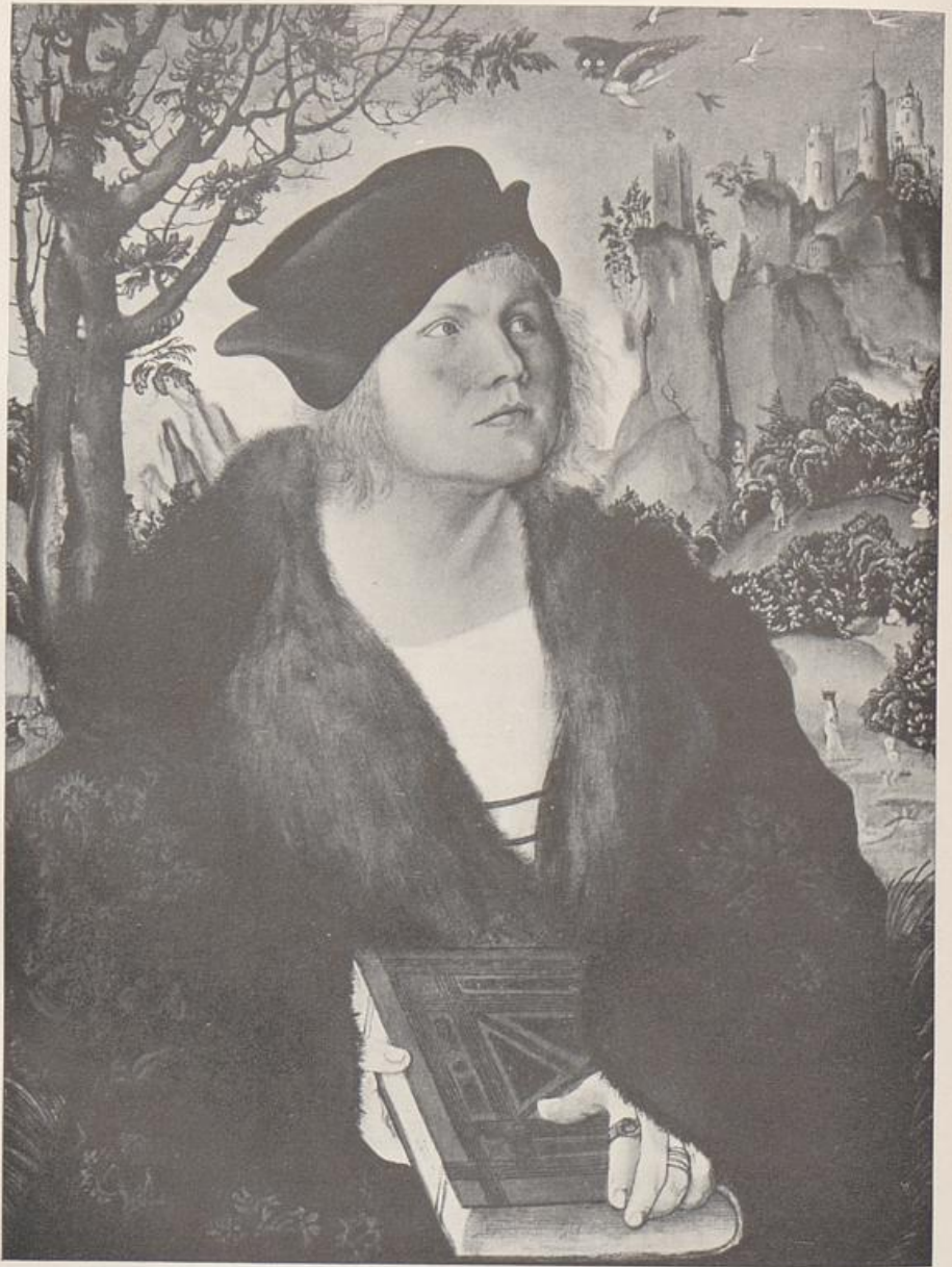
119. Lukas Cranach d. Ä., Bildnis des Cuspinian, Slg. Reinhart, Winterthur