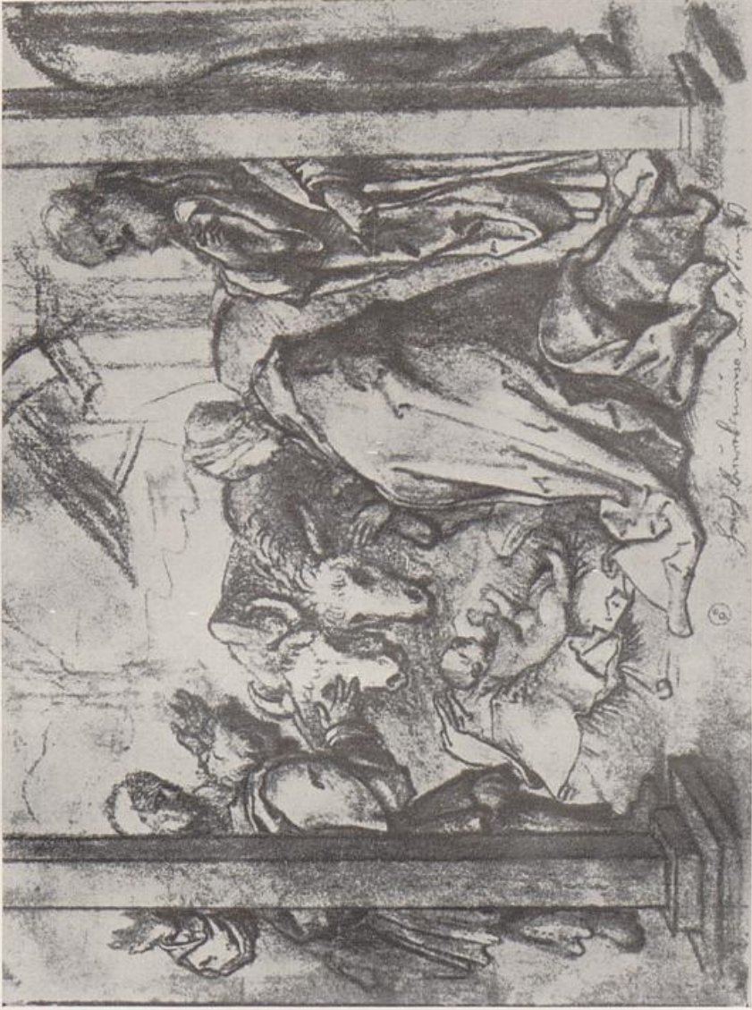
125. Hans Burgkmair, Anbetung der Hirten, Zeichnung, Turin