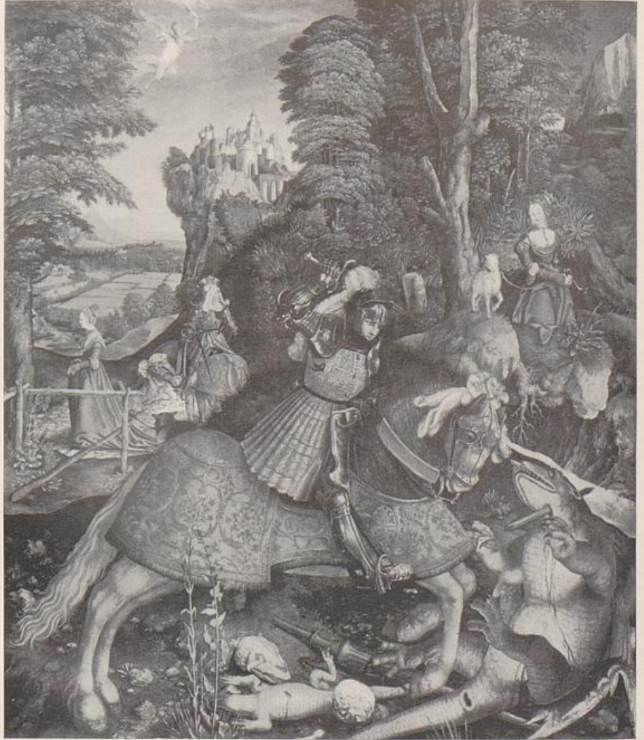
126. Leonhard Beck, Drachenkampf, Wien, Kunsthistorisches Museum