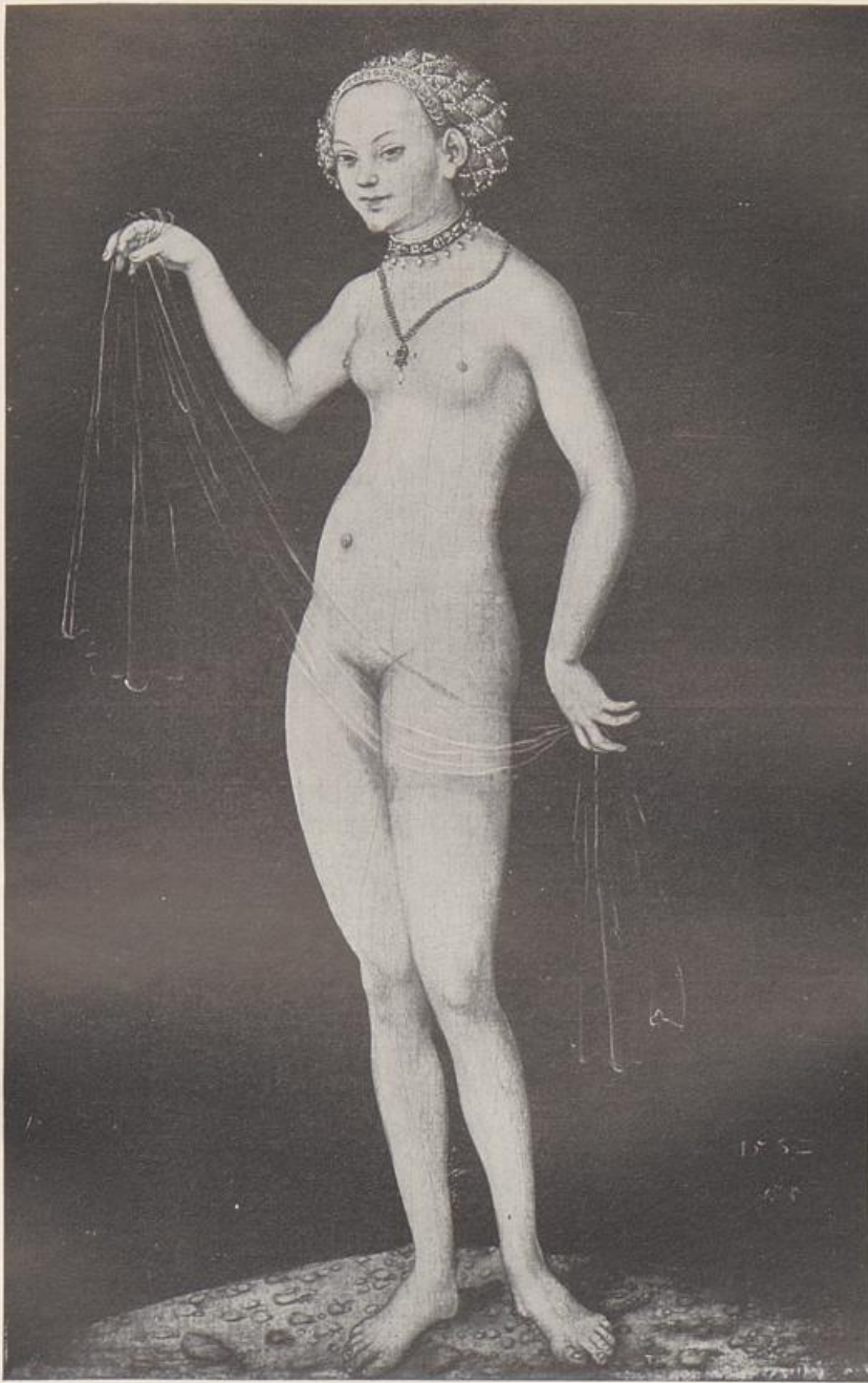
120. Lukas Cranach d. Ä., Venus, Frankfurt, Städelsches Institut