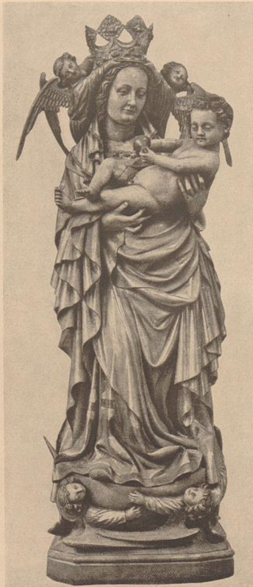
8. Muttergottes. Farbige gefaßte Holzfigur um 1430 im Ostchor von St. Sebaldus in Nürnberg.

Nach Sauerlandt, Mittelalterliche Plastik : Verlag Langewiesche.