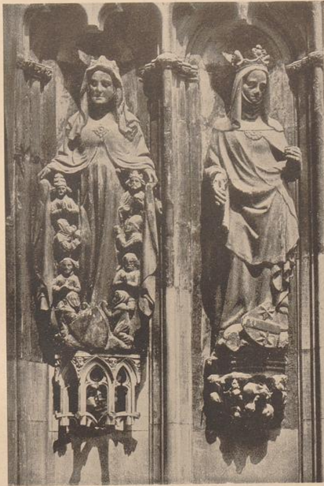
7. Zwei hl. Frauen vom Südportal des Augsburger Domchores. Aus: Hartmann, Gotische Monumentalplastik in Schwaben.

Und nichts verwehrt, vieles erleichtert vielmehr, daß gerade so auch der Ausdruck des Verborgenen, das hinter den Körpern lebt, uns vermittelt wird. — So, und nur so, begreift man, daß die nordische, besonders die deutsche Entwicklung stellenweise genau umgekehrt verläuft, als der empfängliche Unwissende, den die Ästhetik der Renaissance noch bindet,