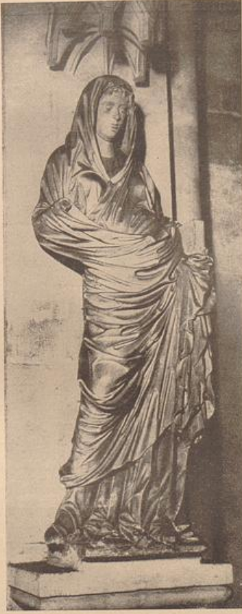
4. Maria, Statue des 13. Jahrhunderts im Bamberger Dome.