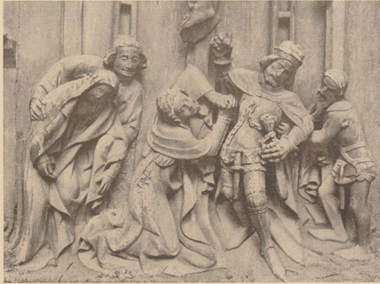
3. Teil vom Relief des Nordportales an der Prager Teynkirche. Aus: Stix, Monumentale Plastik der Prager Dombauhütte, Wien 1908.