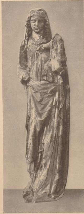
5. Muttergottes von der Ecke des Rottweiler Kapellenturmes (vor Mitte 14. Jahrh.).

entspricht. Man kann also auch ein großer Plastiker sein, ohne seine Aufgabe in der richtigen Darstellung der organischen Vergliederung des Körpers zu finden. Daß diese Tatsache uns noch immer ungewöhnlich vorkommt, wird in diesem Falle wohl wirklich mit Recht einer allgemeinen Abhängigkeit der Auffassung künstlerischer Leistungen von der Renaissance zugeschrieben. Der bewußte Umblick in der Welt des Organischen, das anatomische Wissen, das als Absicht schon ein Geschenk der Renaissance ist, hat die Bewertung anders gewollter Kunst sicherlich schwer belastet. Und wenn heute die unsterbliche Kraft der alten deutschen Plastik langsam in das allgemeinere Bewußtsein einzudringen scheint, so ist es wohl kein Zufall, daß gleichzeitig jene Belastung des ästhetischen Gefühles ebenfalls allgemeiner zurückweicht. Von den Schönheitswerten der Renaissance her sieht die deutsche Plastik tatsächlich