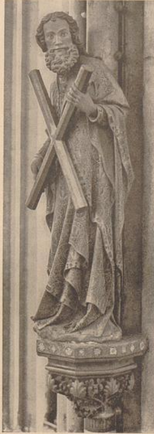
6. Hl. Andreas, Pfeilerstatue vom Domchor zu Köln.

wie verrutschte Antike aus — und sie ist es doch höchstens hier und da bei späteren Italisten —, auf diesen Standpunkt hin wird sie gerade an den Stellen ihrer höchsten Kraft „verkrüppelt“ wirken. Und „verkrüppelt“ ist schon eine Übertragung aus der mehr wissenden Beobachtung des Leiblichen. Um unsere Plastik überhaupt als Plastik zu empfinden [und nicht etwa als eine Graphik in Stein und Holz] muß man den Begriff des Plastischen selbst erweitern — über eine künstliche Verengerung hinaus, die übrigens z. B. auch die ägyptische Kunst ausschließen müßte. Man darf ihn nicht so sehr vom dargestellten Gegenstande abhängig machen; man muß sich fragen, welche Kräfte im Beschauer angerufen werden. Plastik haben wir da, wo unsere Fähigkeit, organisch körperhafte Formen aus dem Raume herauszuheben, die gleiche Fähigkeit, die wir sonst rein empfangend auch außerhalb des Künstlerischen anwenden, — wo diese Fähigkeit in schöpferisch gebender Weise ausgenutzt wird, wo man ihr neue, vom Künstler gewollte Zusammenhänge anbietet. Auch so noch wird die für den Begriff der Plastik unerläßliche Erweckung der Vorstellung „Mensch“ und „Lebewesen“ mit erfaßt. Denn daß jene Zusammenhänge möglichst genau mit den „wirklichen“ zusammenfallen müßten, ist eigentlich nur eine Voraussetzung. Verbindungen doch noch als Verbindungen aufzufassen, d. h. die geformte Masse als „menschlich“ zu empfinden (Abb. 3).