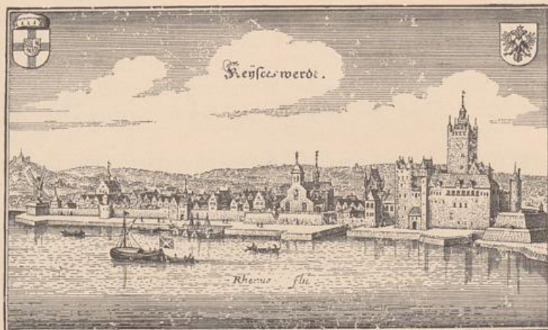
Abb. 68. Kaiserswerth. Nach Merian.