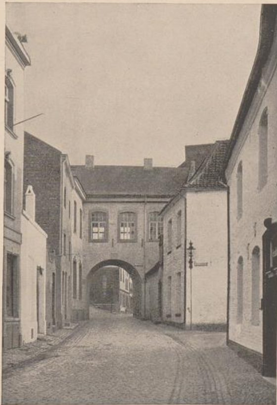
Abb. 70 Heinsberg. Das Binnentor. Vgl. Abb. 71.