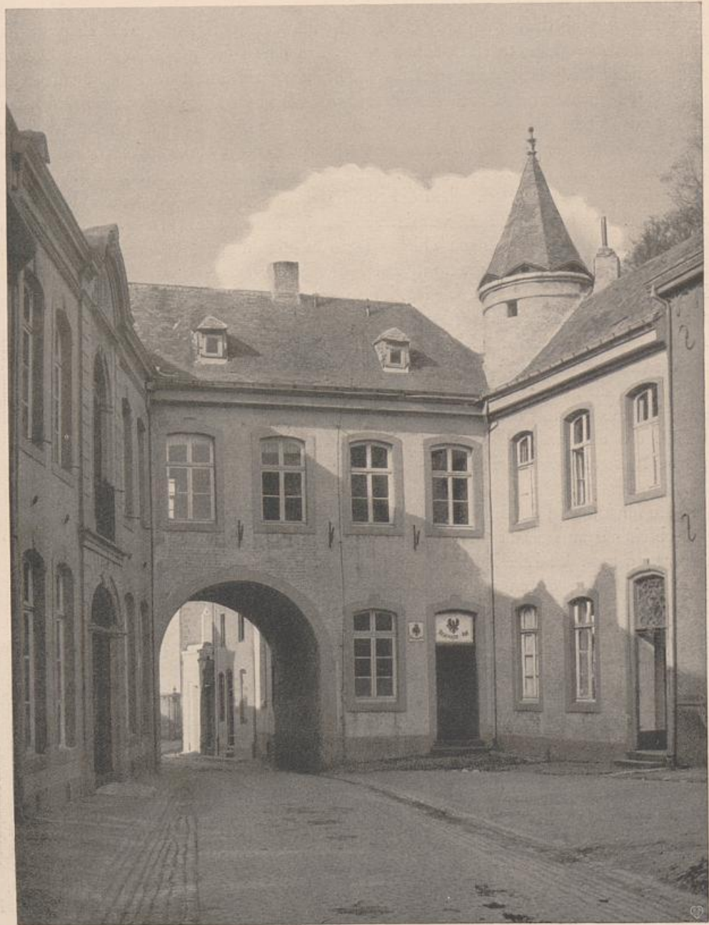
Abb. 71. Heinsberg. Binnentor. Vgl. Abb. 70.