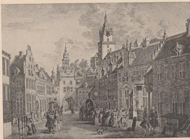
Abb. 69. Cleeve. Das Binnentor. Nach einer Darstellung vom Jahre 1745.

Wer auf Krakau saß, zählte auch zur Zunft der Strauchdiebe. Das war nun einmal geheiligte Krakauer Tradition. Und es war