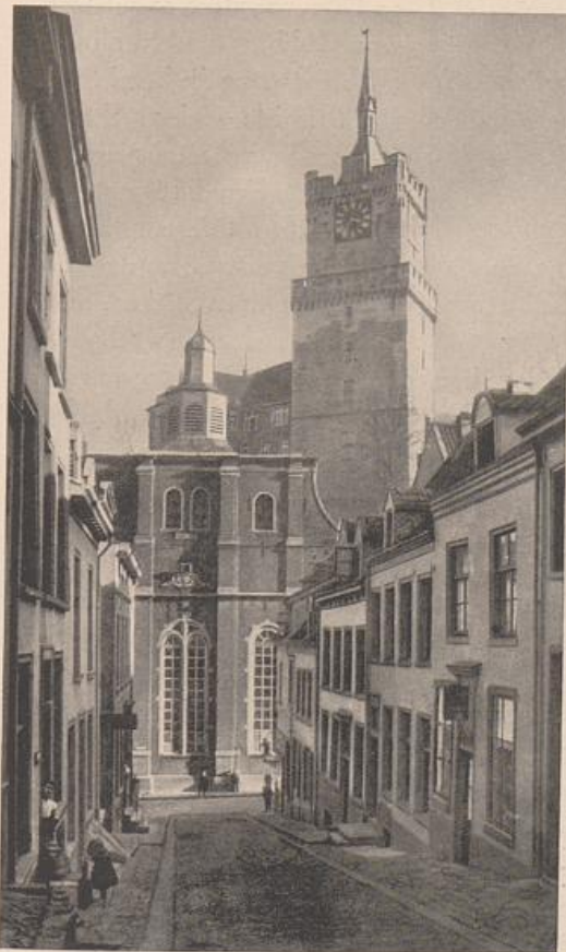
Abb. 72. Cleve. Blick auf die Reformierte Kirche und den Schwanenturm.

Um die Landesburg oder die Pfalz der Gaugrafen sammelt sich die Stadt. So in Aachen, Zons, Zülpich, Kempen, Lechenich, Cleve, Heinsberg usw. Und ein Graben, später eine Wehrmauer mit Toren und kleinen Wachthäuschen, zieht um die Ansiedelung einen Ring. Die Terrainverhältnisse der Burg bedingten die Anlage der Stadt.