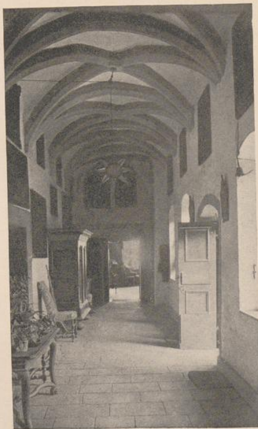
Abb. 183. Schloß Millendonck. Korridor.

Vor dem Fischkaufhause stand der große Kran. Neben dem Stapelhaus führte die Fischport durch die Stadtmauer (Abb. 79). Darüber hinaus wuchs der gewaltige Ostchor von Groß St. Martin mit seinem imponierenden reich gegliederten Vierungsturm auf (Abb. 184). Es ist das schöne Bild, das uns von Köln her bei der Einfahrt von der anderen Rheinseite begrüßt. Man mißt den Turm- und Chorbau mit den schmalbrüstigen Häusern zu seinen Füßen an der Werft und der Fensterfolge des Lagerhauses, dessen Zinnen noch nicht an die Zwerggalerie des Ostchors heranreichen. Heute ist der Hafen vor Groß St. Martin verschwunden. Als um das Jahr 1890 die alte Stadtmauer fiel und eine neue breite Werft längs dem Ufer geschaffen wurde, mußten die