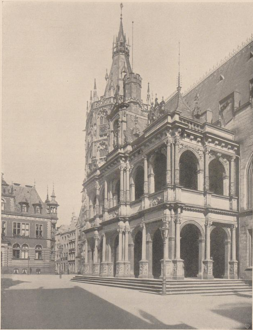
Abb. 188. Köln. Rathausplatz. Vgl. Abb. 185.