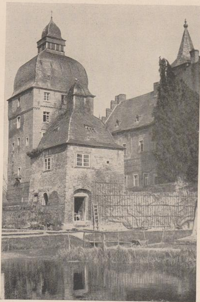
Abb. 182. Schloß Millendonck. Vgl. Abb. 180.

Mit dem Ausgange des 15. Jahrhunderts war auch der Gürzenich, der bis dahin nur als Re-präsentationsbau galt, als Lager- und Kaufhaus umgewandelt worden, da die übrigen bei dem wachsenden Handel überlastet waren. Auch das alte Fischkaufhaus am Rhein genügte nicht mehr den Bedürfnissen. Im Jahre 1546 richteten die „Alderleute und gemeinen Bergfahrer sowie andere Kaufleute zu Deventer“ an den Rat der Stadt Köln ein Gesuch, den alten Bau wegen der Mißstände zu erweitern.