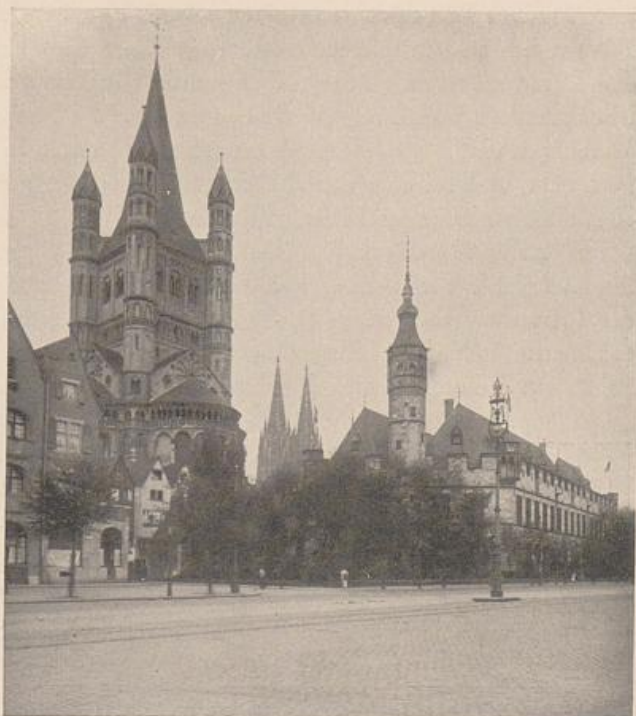
Abb. 184. Köln. Groß St. Martin und Fischkaufhaus. Vgl. Abb. 79.

Häuser an der Fischport auch weichen. Der Chor von Groß St. Martin ward freigelegt. Die lustigen, bisher verdeckten Giebel der Hafengasse kamen zum Vorschein und zeigten dem neuen Rheinufer ihre Fronten. Jetzt war das alte malerische Stadtbild in Gefahr. Breite und hohe Neubauten hätten dem Ostchor den monumentalen Akzent genommen. Aber die überaus geschickte Heimatschutz- und Städtebaupolitik der Stadt Köln in den letzten Jahrzehnten hat einen vorbildlichen Ausweg gefunden. Aus dem gewonnenen Terrain nach dem Rhein zu erhielten die Besitzer der Häuser der Hafengasse von der Stadt kostenlos Gelände, wenn sie bei Neubauten eine bestimmte Höhe einhalten und neue Giebel die alte Melodie