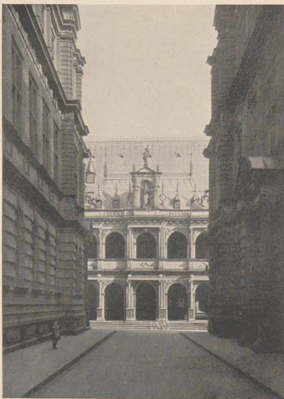
Abb. 185. Köln. Portalgasse. Vgl. Abb. 188.