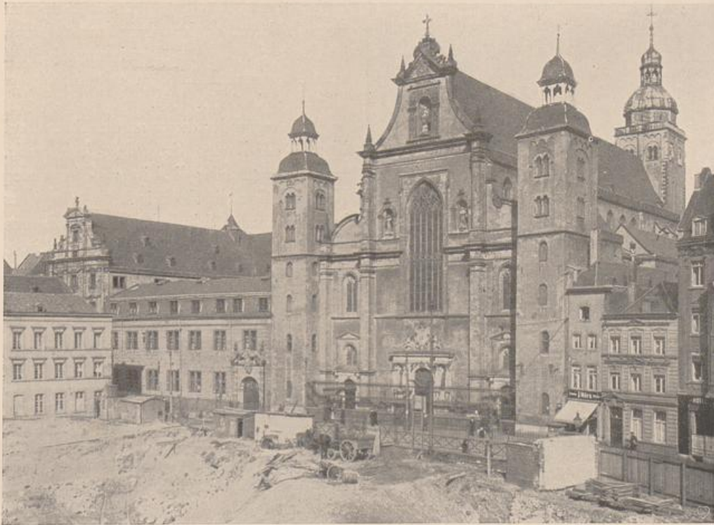
Abb. 186. Köln. Jesuitenkirche und Kolleg.