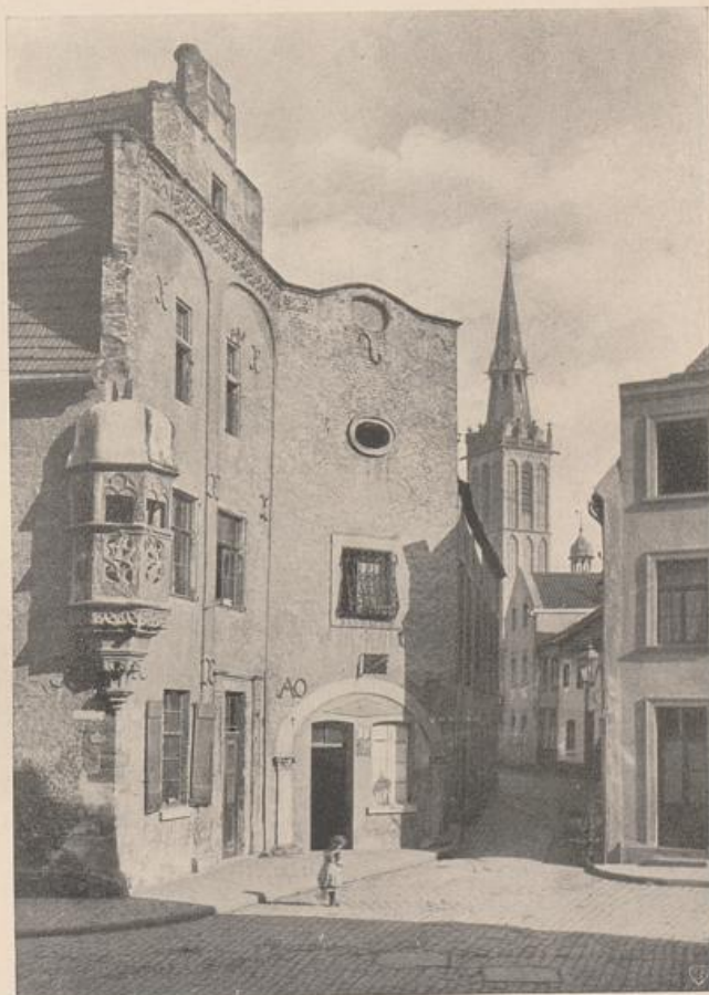
Abb. 190. Düren. Straßenbild am Bongard.