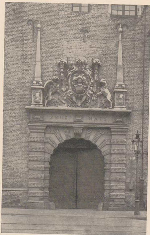
Abb. 191 Köln. Zeughaus. Portal. Vgl. Abb. 187