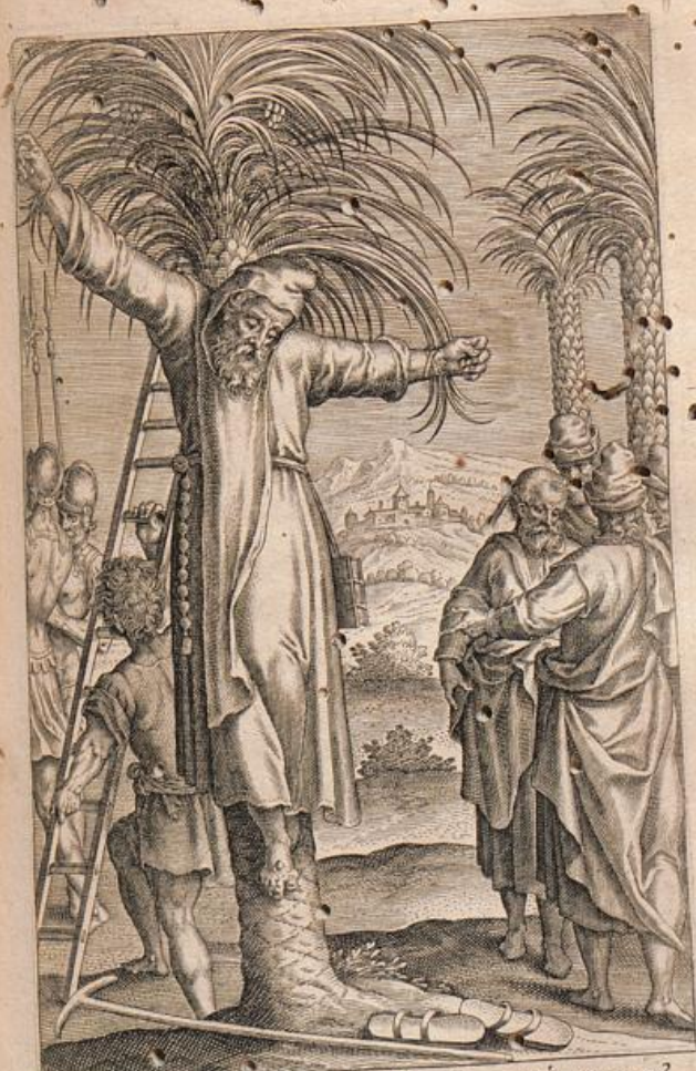
Quam bene uncta tuæ Paphnuti præmia pugnae? 15. Palma crucem, palmam crux generosa dedit.