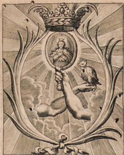
Speculum passionis, et leuaminis pro columba gemente.