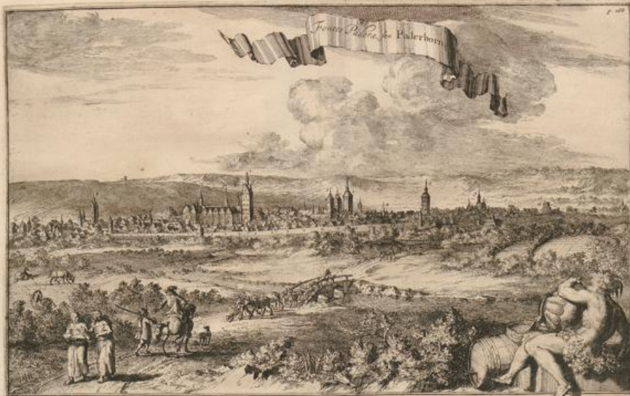
1. Kirche, Cathedrale, S. K. V. 2. Collegium S. Augustini 3. Hofkirche S. Michael, St. Augustinum, S. Marien 4. Hofkirche S. Marien, S. Marien 5. Hofkirche S. Marien, S. Marien 6. Hofkirche S. Marien, S. Marien 7. Hofkirche S. Marien, S. Marien 8. Hofkirche S. Marien, S. Marien 9. Hofkirche S. Marien, S. Marien 10. Hofkirche S. Marien, S. Marien 11. Hofkirche S. Marien, S. Marien 12. Hofkirche S. Marien, S. Marien