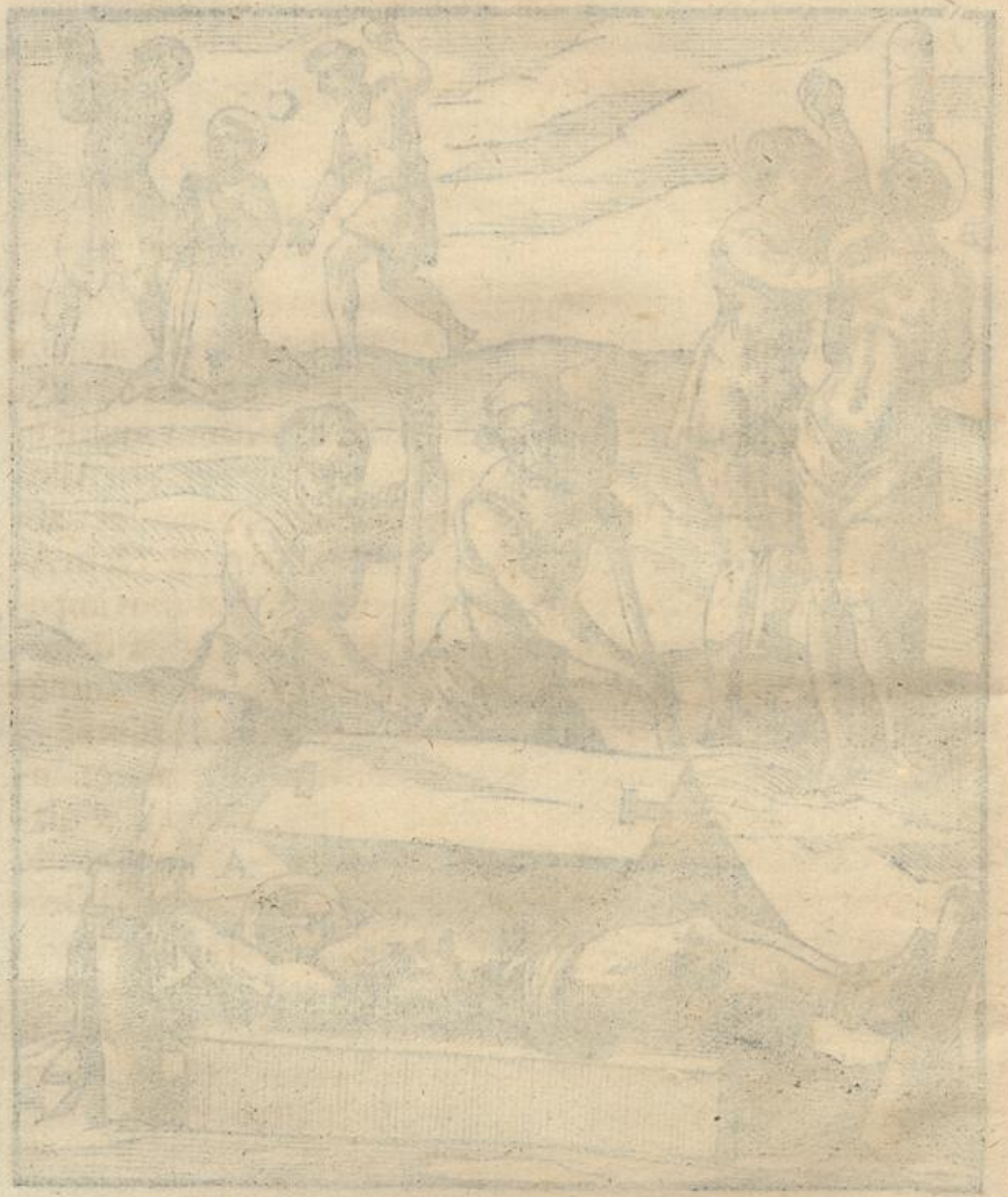
A. Martyr aliquando hoc modo lapidatus percutusque B. Tunc, al. hic, colitur, eius modis percutusque C. Lapidibus non tantopere cruciatus.