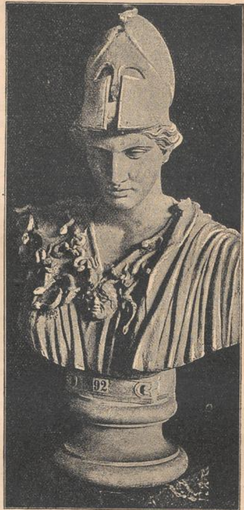
Kolossalbüste der Pallas Athene in der Glyptothek zu München 10 ).