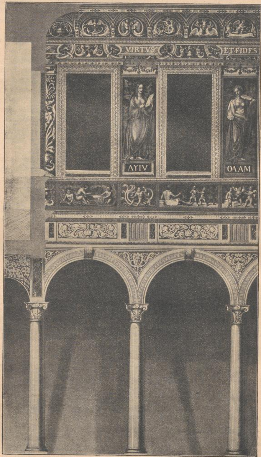
Partie des Hofes in der Casa Taverna zu Mailand 189) .