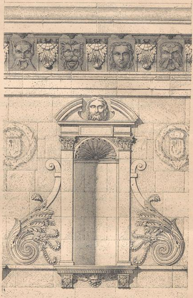
Wandpartie von der Kirche St.-Florentin zu Yonne 144) .