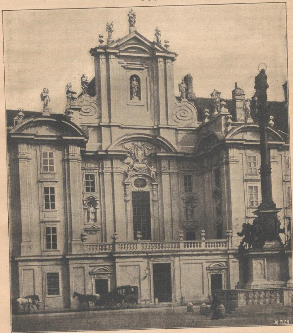
Façade der Pfarrkirche »Am Hof« in Wien.

gehängen u. f. w. geschmückt. Oder es erhalten die eingebogenen Formen an beiden Enden nach oben gerollte kleine Voluten, so dafs sie in dieser Gestalt ebenfalls eine innere Spannung bekunden und damit der Wirkung des Strebepfeilers einen sichtbaren Ausdruck verleihen.