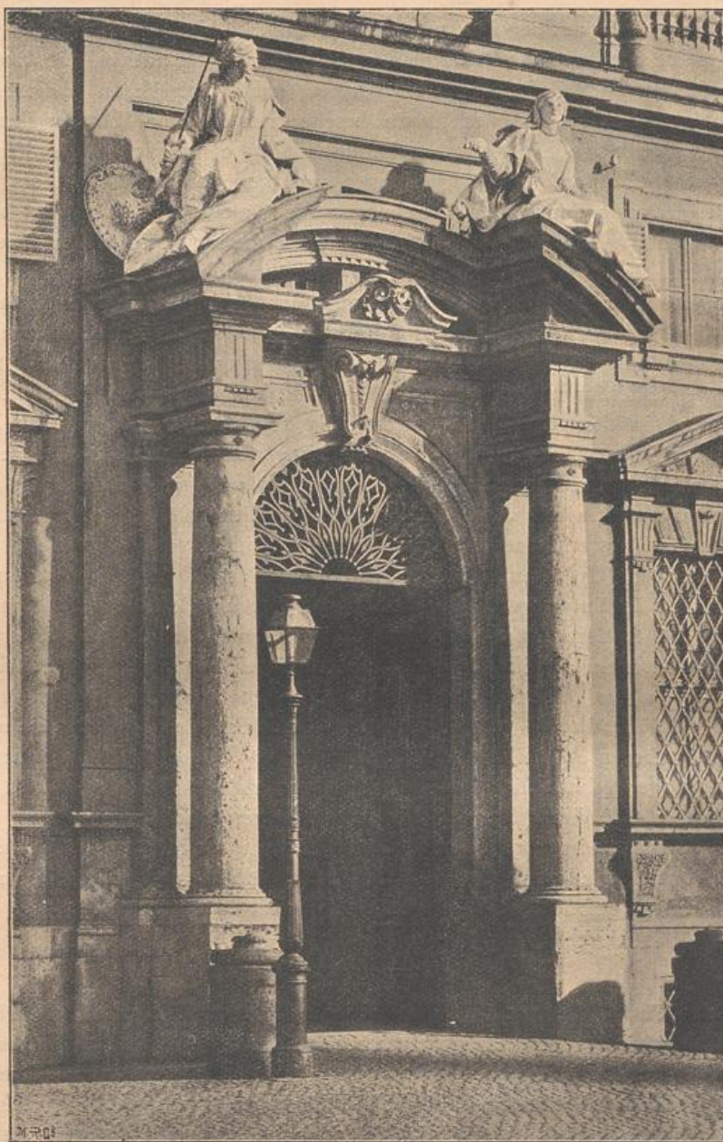
Portal des Palastes della Consultà auf dem Quirinal zu Rom.

dreieckes erheben sich auf den Ecken die abgebrochenen Enden eines Giebels oder volutenartige Decorationsstücke, während die Mitte durch eine reich geschmückte Tafel oder ein Wappen ausgefüllt wird. Die feitlichen Verkröpfungen bedingen