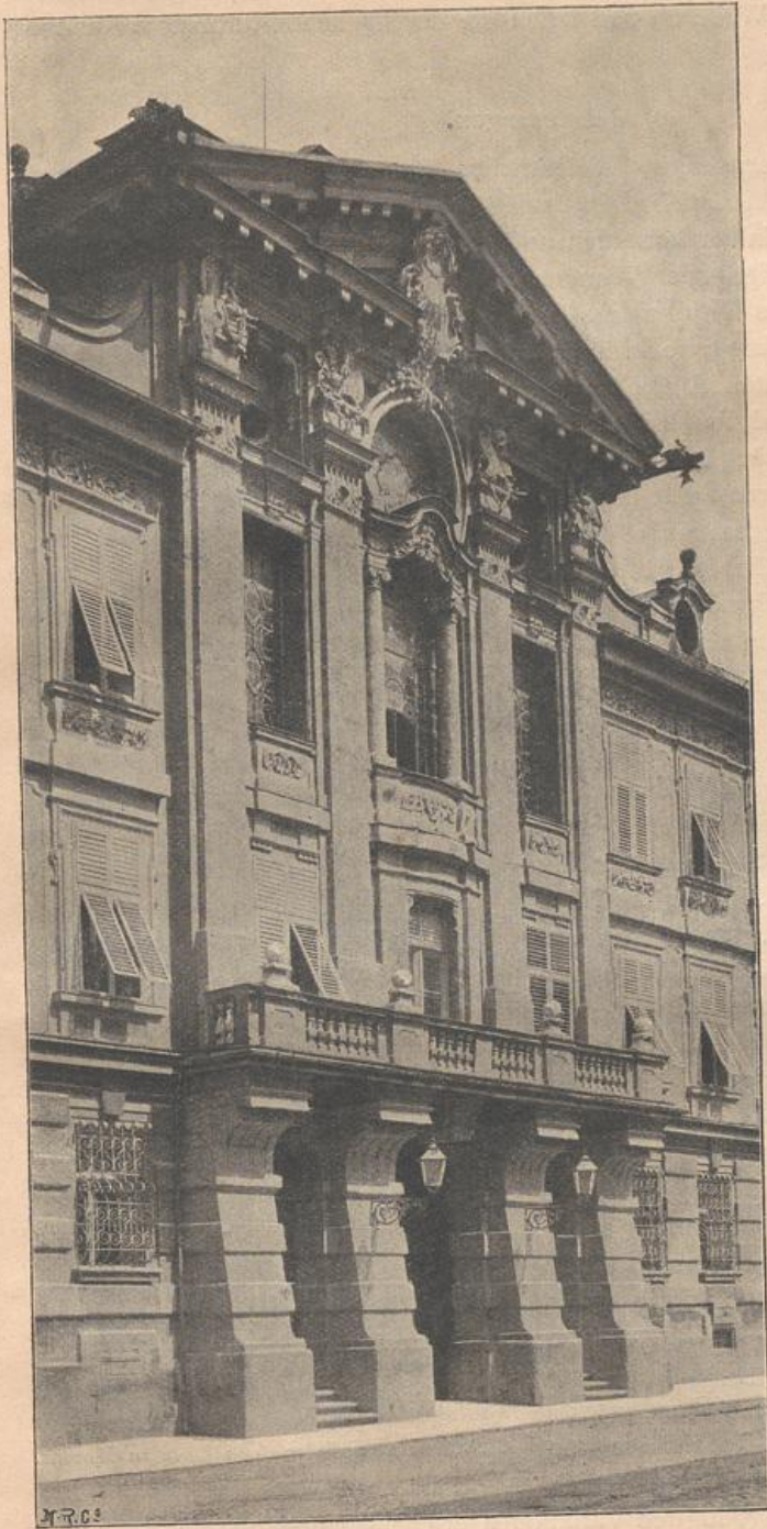
Mittelbau des Ständehauses zu Innsbruck.

seitlichen Abchlüsse geltend, als an den verhältnismässig ruhigen Palaftfaçaden. Halbfäulen oder frei stehende Säulen, oft doppelt neben einander gestellt und wie die Pilafter auf einen lifenenartigen Hintergrund gefetzt, geben die beabsichtigte