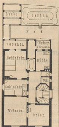
Miethaus zu Stuttgart, Kreuserstraße 267). 1/400 w. Gr. Arch.: v. Bok.

Die Häuser bestehen meist aus Sockel-, Erd- und Obergeschoss und teilweise ausgebautem Dache. Küche und Zubehör, Mädchenkammer für die Wohnung im Erdgeschoss werden dann oft in das Sockelgeschoss gelegt, während die genannten Räume für die Wohnung des Obergeschosses in Dachausbauten untergebracht sind. Für die Kellerräume dieses Geschosses kann eine kleine Treppe vorhanden sein, die nur für feine Bewohner dient.