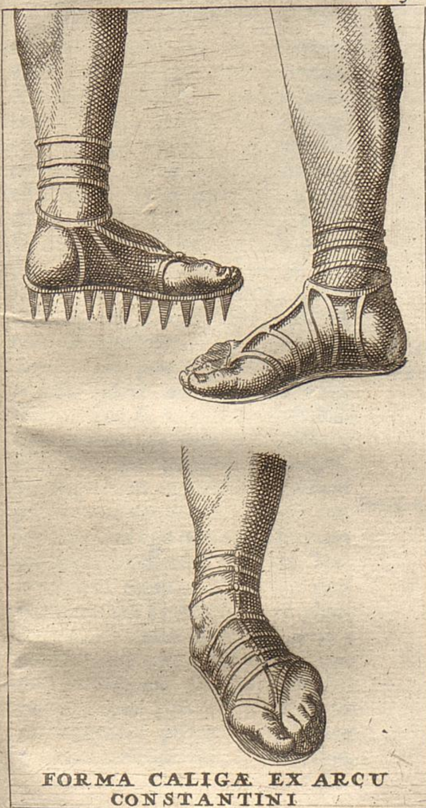
FORMA CALIGÆ EX ARCU CONSTANTINI