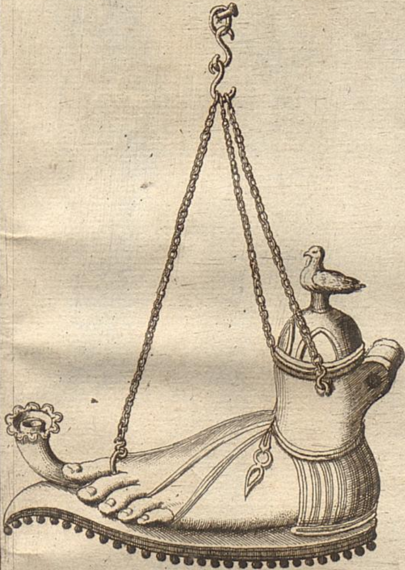
CALIGA MILITARIS SUB LUCERNE SPECIE