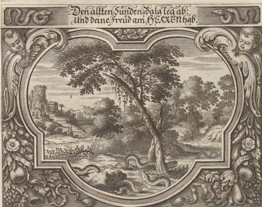
Georg Strauch del.

Solche wird beschrieben von dem heiligen Apostel Paulo/an die Römer im 3. Cap. vom 11. bis an den 14. Vers.