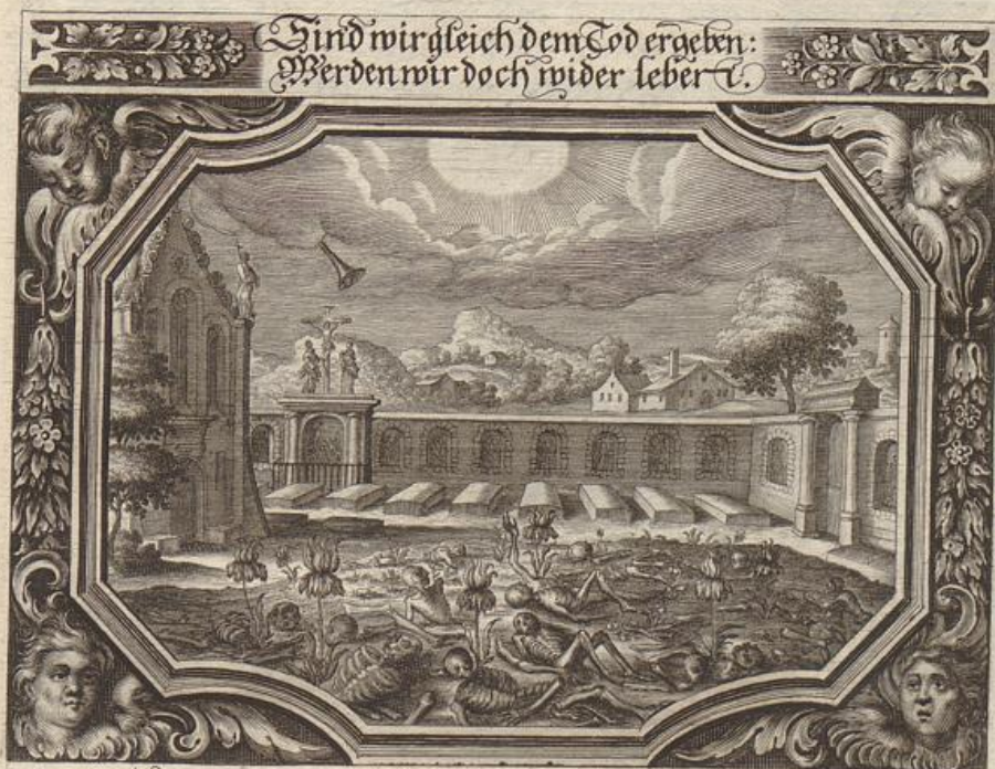
Georg Strauch Del.

Solche wird beschrieben/von dem heiligen Apostel Paulo/ in der 1. an die Thessalonicher/im 4. Cap. von 13. bis an den 18. Vers.