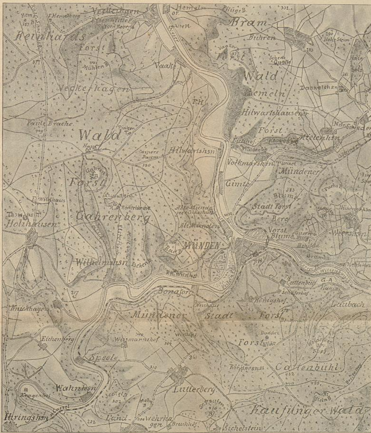
Masstab 1:100000 0 1 2 3 4 5 Kilometer.