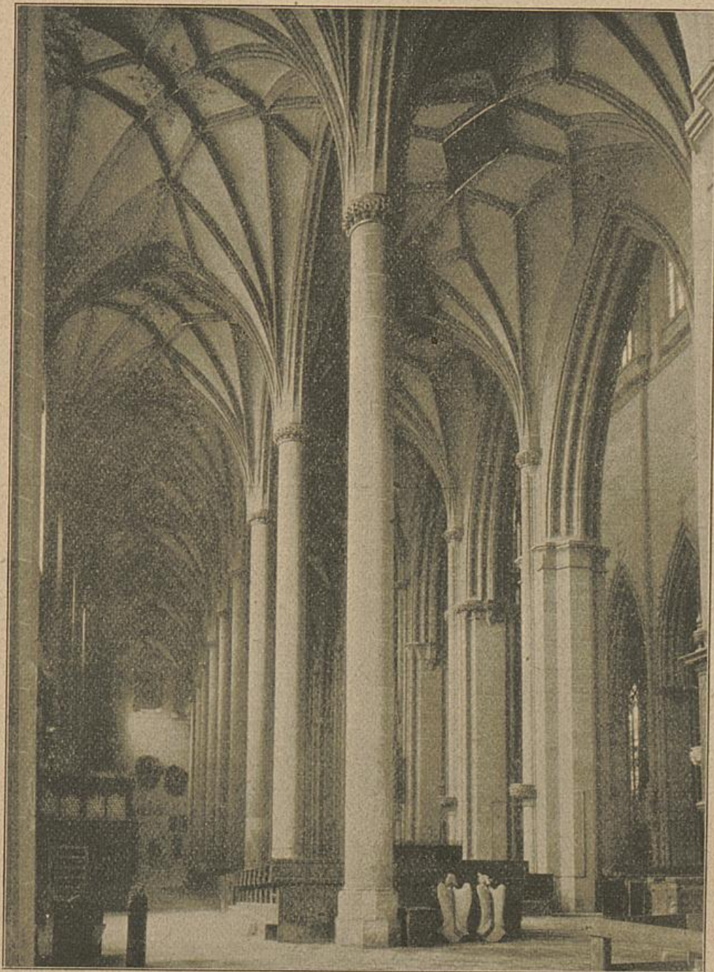
Nördliche Seitenschiffe (von Westen).