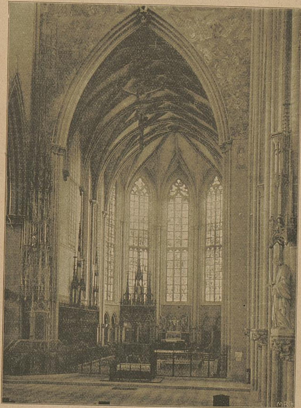
Choranficht mit Sakramentshäuschen (links).