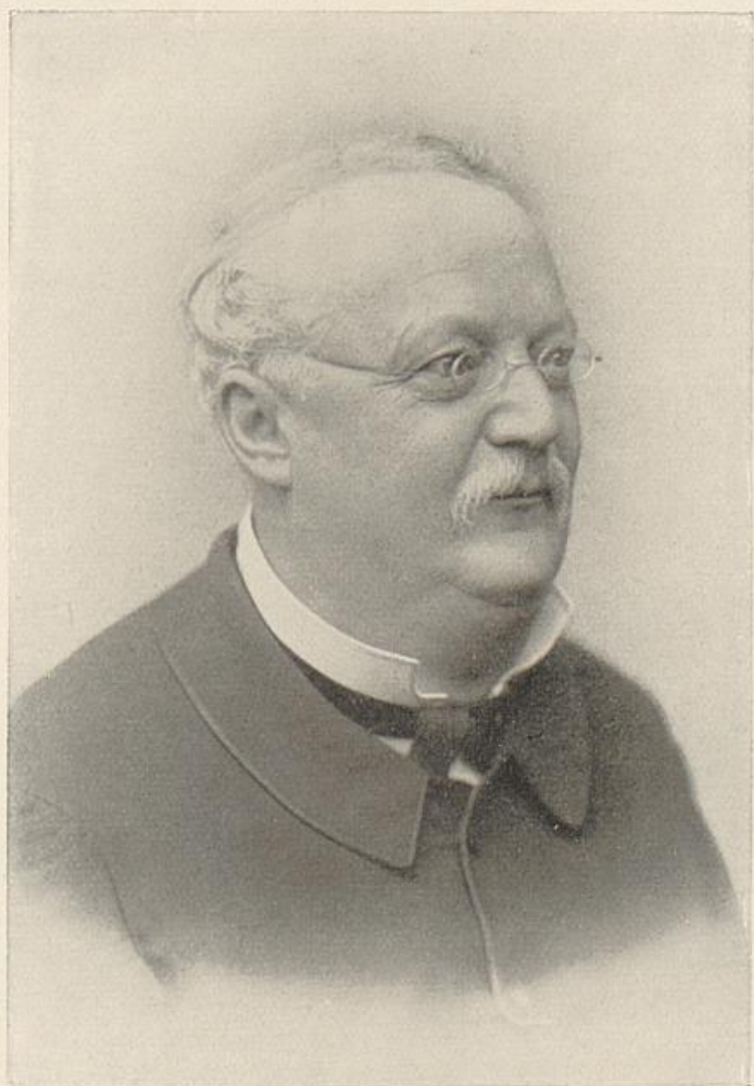
Conrad Ferdinand Meyer. Nach einer Photographie von 1891.