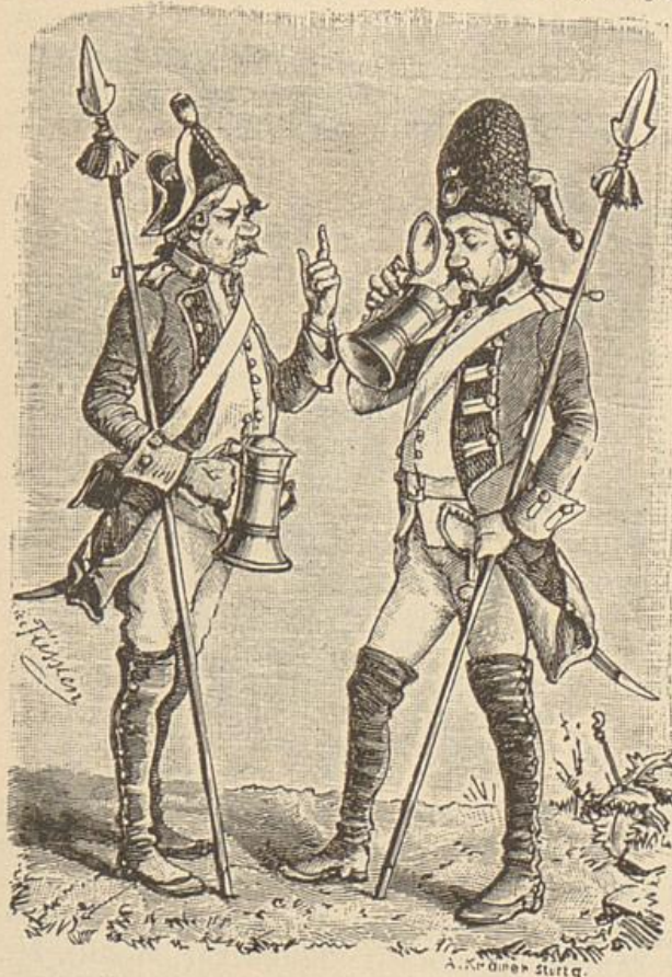
Ulmer Stadtjoldaten. (18. Jahrh.)

Unter dem Bahnhofplatz fließt die „kleine Seite“ oder der linke Arm der Blau; dieselbe tritt hinter dem östlichen Häuserviertel wieder zu Tage.