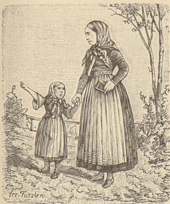
Bäuerin v. d. Ulmer Alb.

der Neuthorstraße. Letzterer führt auch den Namen Mühlsteig, da auf ihm die Müller zur Alb führen.