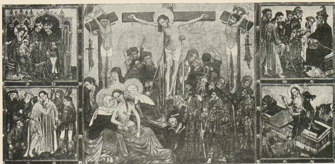
Altar in St. Pauli zu Soest

Inventarisierung der Kunstdenkmäler der Provinz Westfalen.