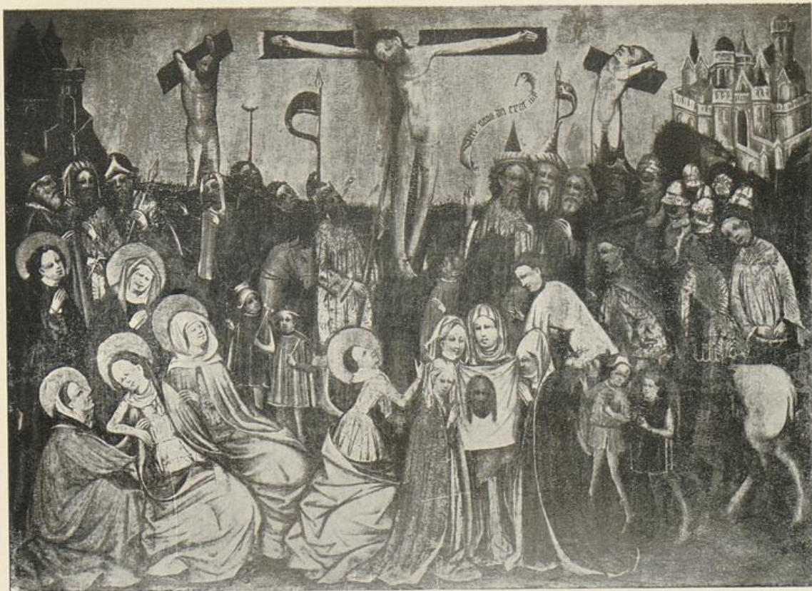
Jakobsaltar der Wiesenkirche

Inventarisierung der Kunstdenkmäler der Provinz Westfalen.