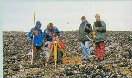
Geländearbeiten im Dauerfrostboden, Nähe Juvasshytta

Exkursionen sind integrierter Bestandteil der Studiengänge im Fach Geographie. Hier wird theoretisches Wissen aus Vorlesungen, Seminaren und Lehrbüchern mit den konkreten Gegebenheiten vor Ort verknüpft. Die Themenspanne der Exkursionen reicht von physisch-geographischen Phänomenen bis zu speziellen Fragestellungen der Anthropogeographie, z. B. der Analyse von Entwicklungen in touristischen Destinationen.