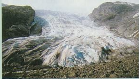
Stark vorstoßender Gletscher Bersetsbre