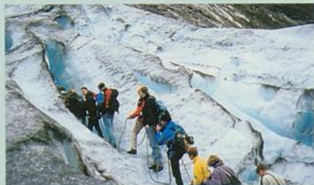
Randspalten an der Gletscherzunge des Nigardsbre