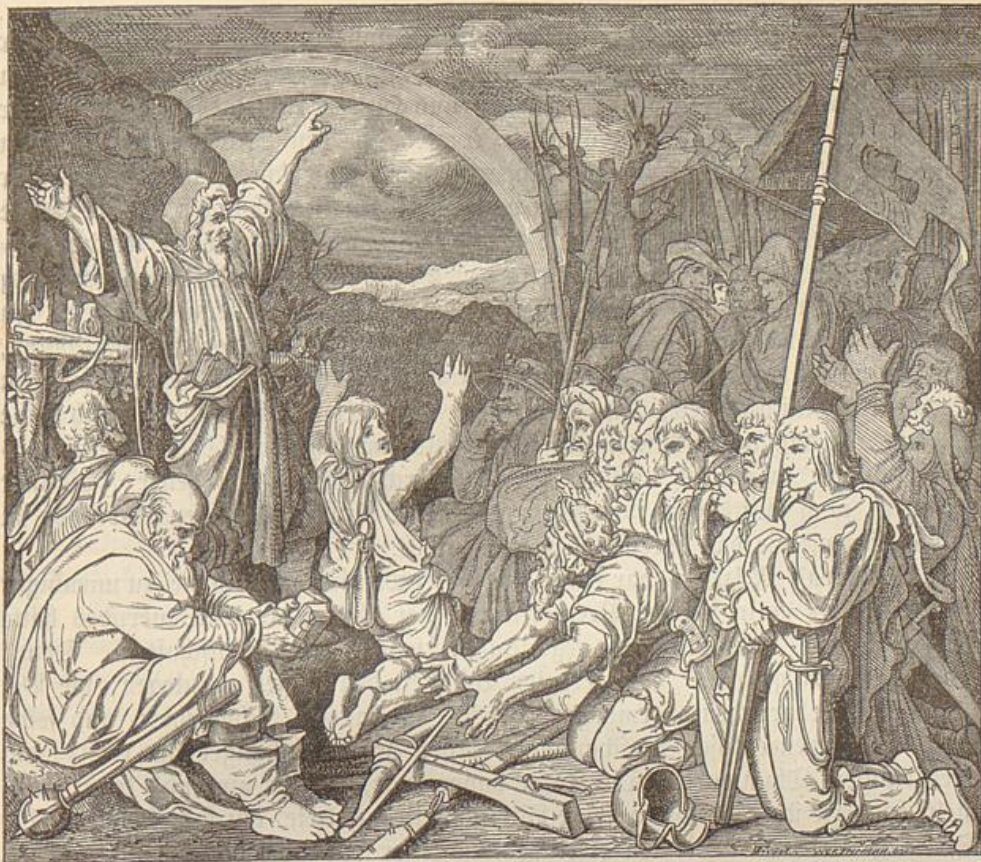
Thomas Münzer vor der Schlacht bei Frankenhäusen. Nach Trentwald.