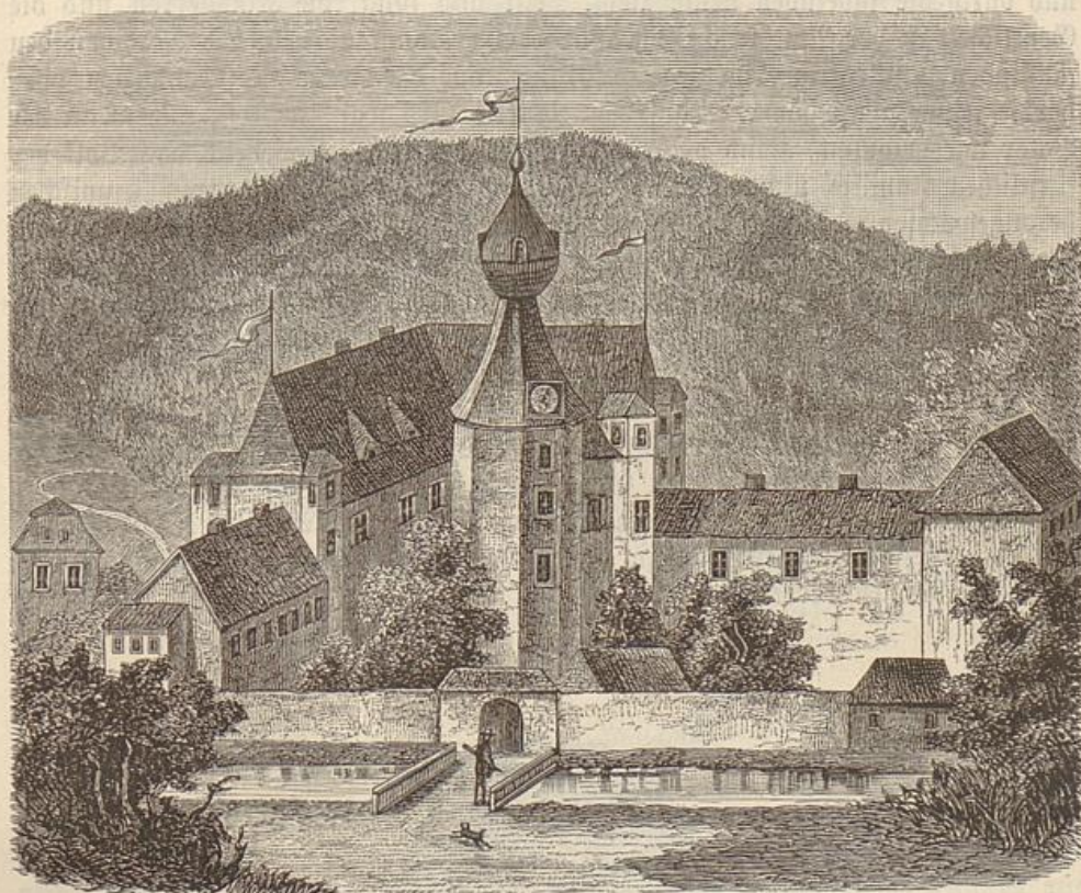
Schloß Fröhliche Wiederkunft.

Aber so weit kam es doch nicht. Auch des Kaisers Absichten hätte es mehr entsprochen, wenn Johann Friedrich seinen evangelischen Glauben aufgegeben und still weiter lebend sich der Religionsordnung des Kaisers unterworfen hätte. Doch da kam er übel an. Niemals hätte Johann Friedrich sich mit einer Verleugnung seines Luthertums Leben und Freiheit erkaufte. Leib und Leben wollte er geben, seinen Glauben nimmermehr. Als sodann Granbella, welcher die Unterhandlung für den Kaiser führte, die Übergabe von Wittenberg und die Abtretung des gesamten Kurlandes verlangte, fand er ihn bereit.