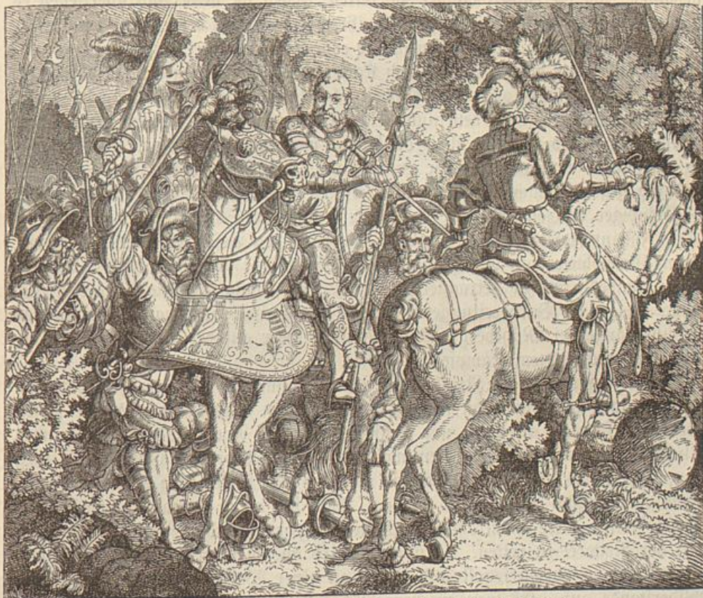
Johann Friedrich gibt sich bei Mühlberg gefangen (24. April 1547).

Moriz war nicht ein Sohn, sondern ein Neffe Herzog Georgs, dieses bitterbösen Feindes der Reformation. Sein Vater, Herzog Heinrich, hatte die Reformation in herzoglichen Landen eingeführt, und Moriz war im lutherischen Glauben befestigt worden am Hofe Johann Friedrichs. Aber Moriz war nicht der Mann, der wie sein Vetter Johann Friedrich in der treuen Ausübung und Wahrung dieses Glaubens seine Befriedigung gefunden hätte. Er war von Ehrgeiz beherrscht und von einem Kraftgefühl, das zu einem größeren Wirkungsfelde, zu erweitertem Machtgebiete hindrängte.