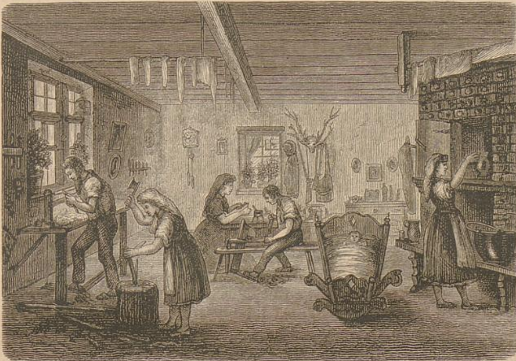
Spielwarenwerkstätte in Thüringen.

Und so ist es denn schwer, den thüringer Volkscharakter zu bezeichnen. Was ich mich über ihn zu sagen getraue, betrachte ich nur als ein Ergebnis der oben skizzierten Geschichte des Volkes. Eine gewisse Virtuosität des Umgangs mit Menschen oder, allgemeiner gefaßt: eine Fähigkeit, sowohl den Menschen als auch den Verhältnissen gerecht zu werden, ist dem Thüringer eigen. Die Lage des Landes und der mannigfache Wandel und Wechsel in seiner Geschichte mag ihm das eingetragen haben.