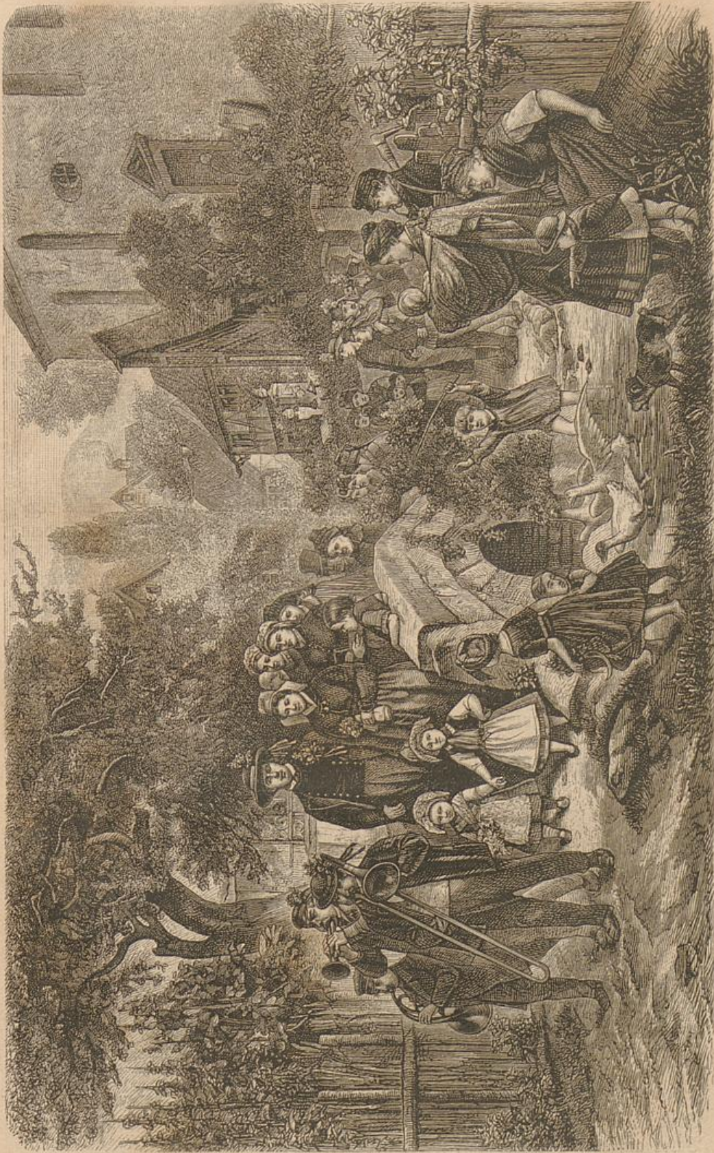
Hochzeitstag in Eschringen.