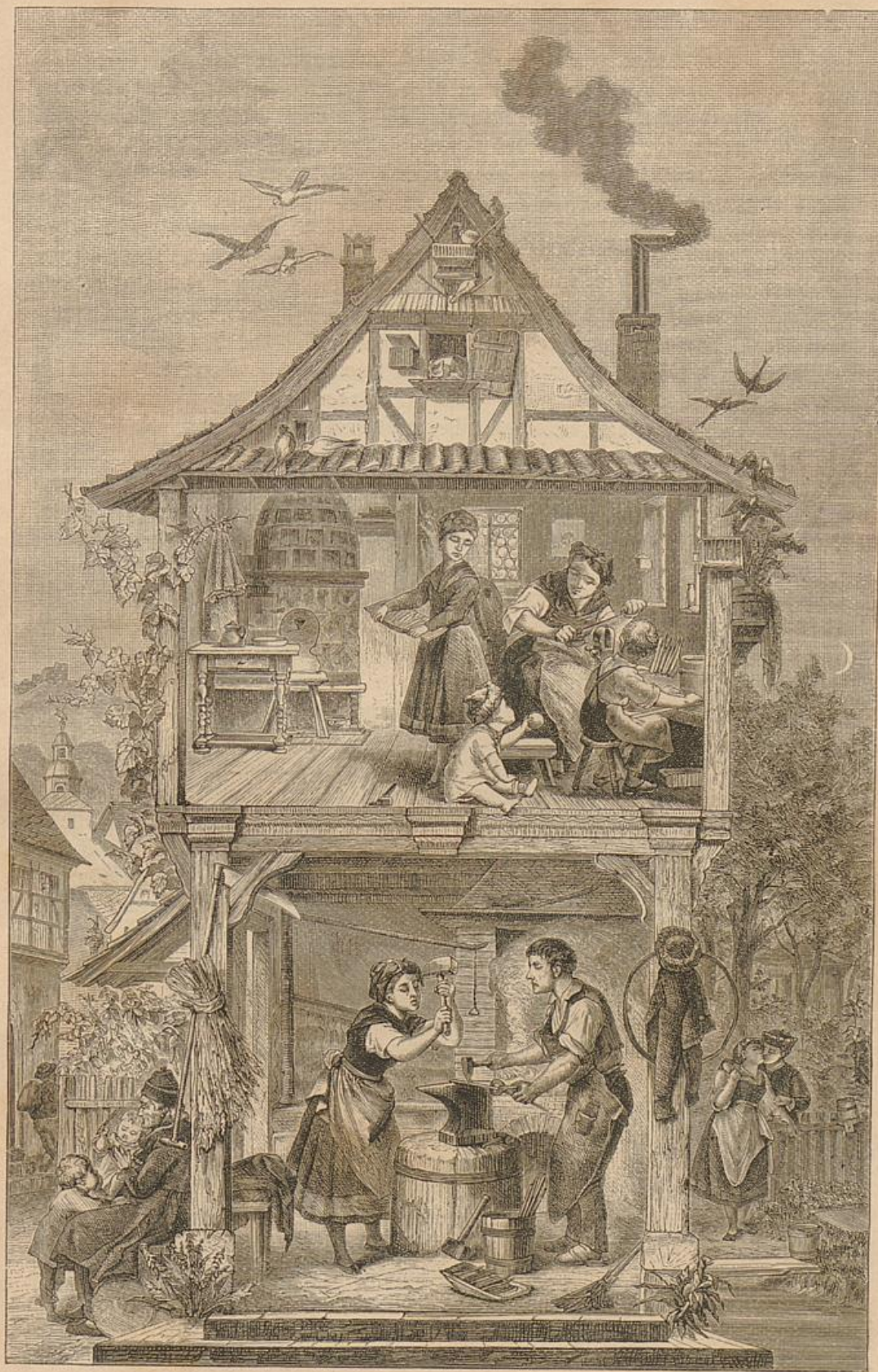
Aus den thüringer Schmiededörfern.