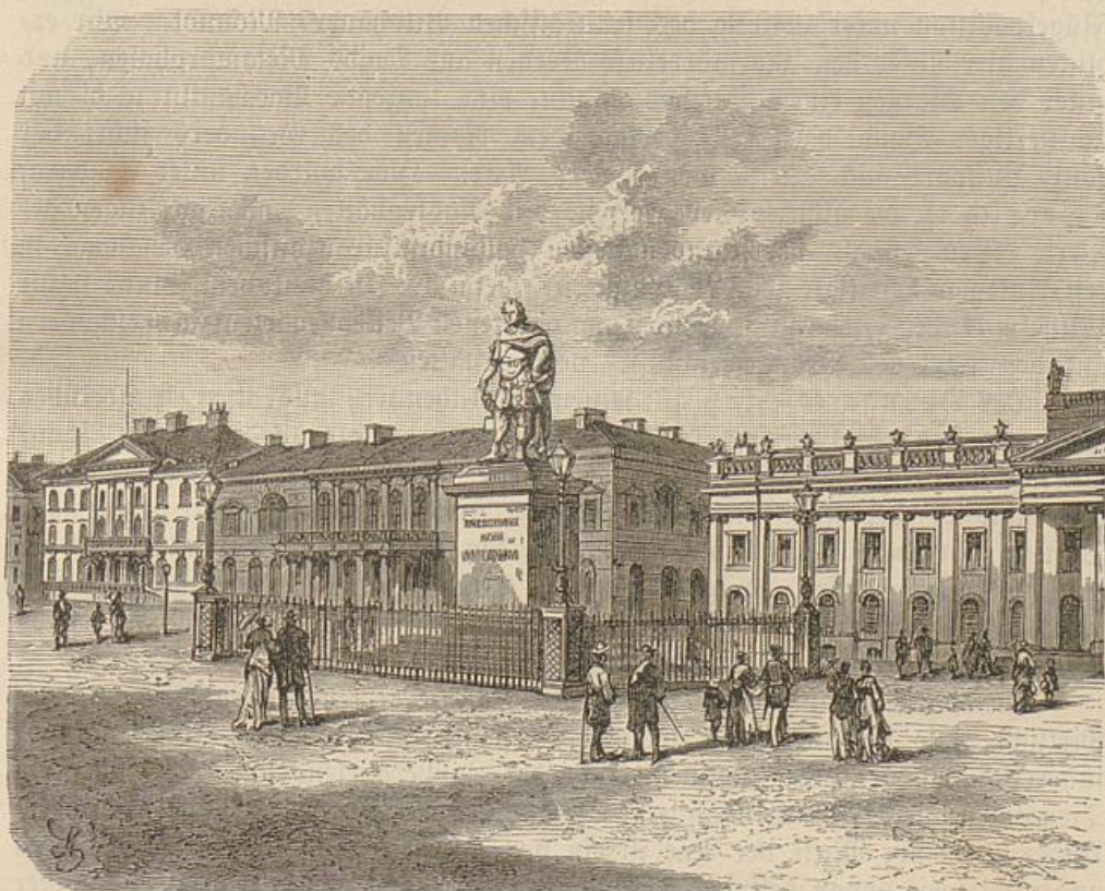
Der Friedrichsplatz in Kassel.

Am Südwestende der Altstadt liegt der runde Königsplatz, wo die Post und das Ministerialgebäude stehen; derselbe hat ein sechsfaches Echo, das verstummte, als in westfälischer Zeit Napoleons Statue in die Mitte gesetzt ward, nach dessen Entfernung aber wieder seinen Mund öffnete: „so gut hessisch war selbst das Echo“.