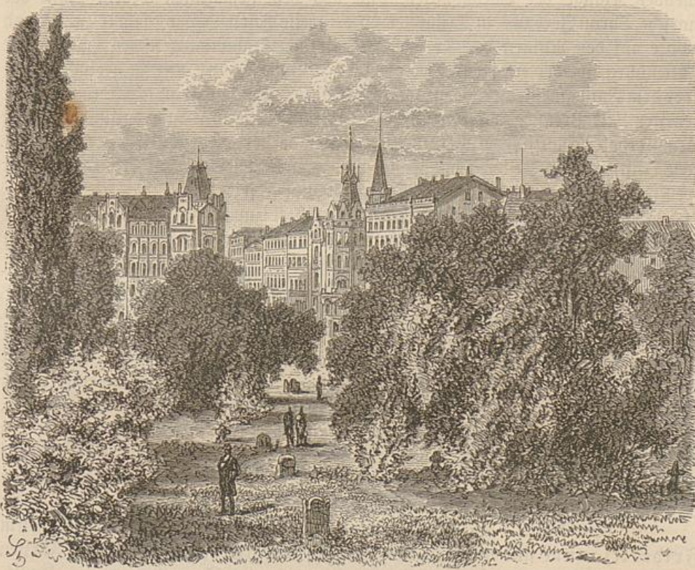
Der alte Friedhof zu Kassel.

Im Siebenjährigen Kriege fiel Kassel widerstandslos in die Hände der Franzosen (1757); danach wechselte es mehrmals den Besitzer und hielt zwölf schwere Belagerungen aus. Unter Friedrich II. (1762) hob sich Kassel wieder: die Befestigungen verschwanden und der geräumige Friedrichsplatz und der Königsplatz wurden geschaffen. Unter den zahlreichen Neubauten verdient besonders das Museum genannt zu werden. In der Mitte des Friedrichsplatzes steht das Standbild Friedrichs II. Leider wird sein Name mit dem Vorwurf gebrandmarkt, daß er 1770—1784 für 22 Mill. Thaler 12 000 Landesinder nach Amerika an die Engländer verkauft und gewaltsame Werbungen, das sogen. Pressen, nicht gescheut habe, wovon bekanntlich der Dichter Seume so Trauriges erzählt.