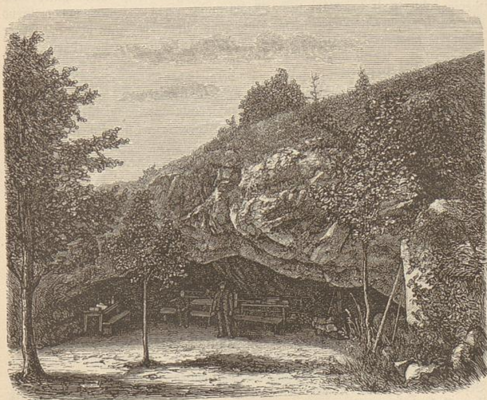
Eingang in die Baumannshöhle.

es mehr und mehr an Besuch verloren. Zwar besitzt es noch jetzt Einrichtungen für Stahl-, Fichtennadel-, Sol-, Douche-, Brause- und Wellenbäder, Milch- und Mollkenkur; doch entsprechen dieselben nur teilweise den Anforderungen der Neuzeit, und die Gasthäuser bieten nicht diejenige aufmerksame Bedienung, die man nach den herrschenden Preisverhältnissen erwarten dürfte. Wandern wir weiter das Seltethal abwärts, so nähern wir uns dem Glanzpunkte desselben. Der Fluß wird zu unaufhörlichen Windungen gezwungen und läßt neben sich nicht viel Raum für Wohnstätten der Menschen und Wiesengründe.