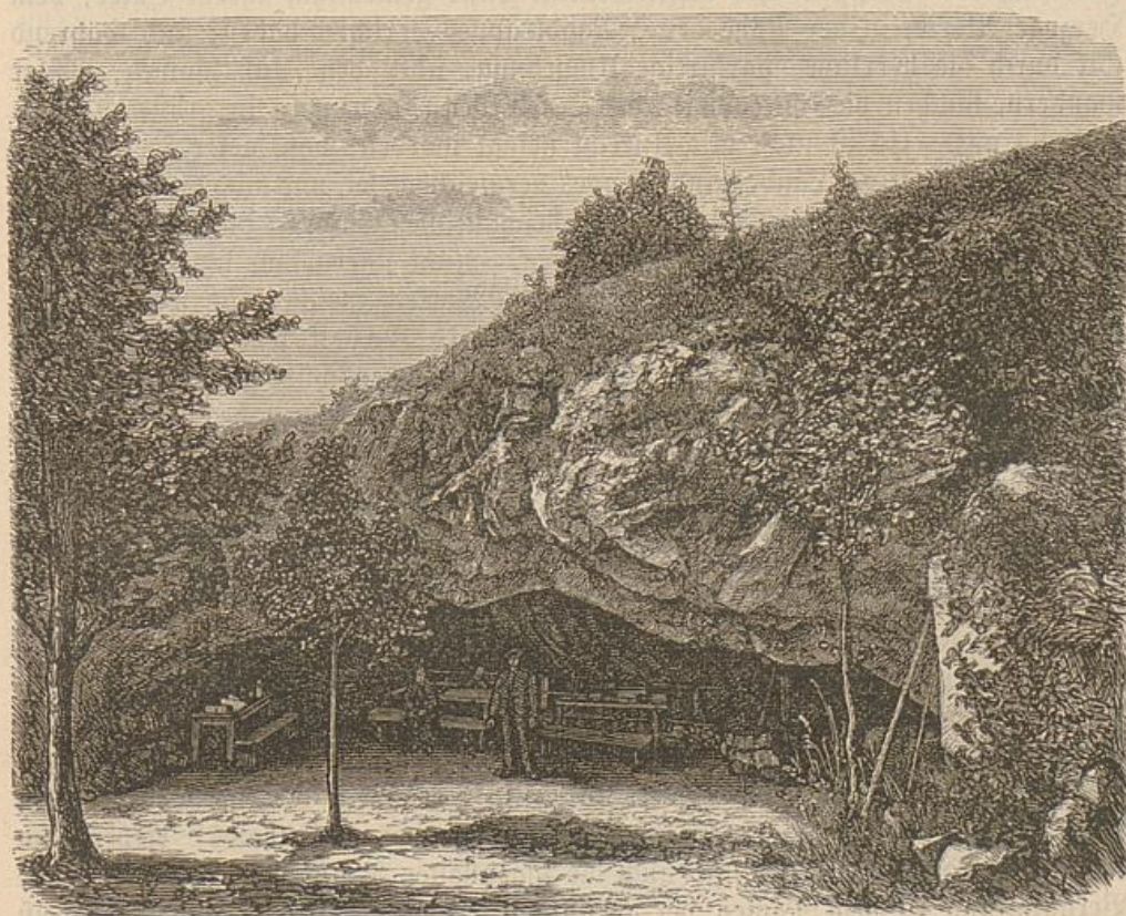
Eingang in die Baumannshöhle.

es mehr und mehr an Besuch verloren. Zwar besitzt es noch jetzt Einrichtungen für Stahl-, Fichtennadel-, Sol-, Douche-, Brause- und Wellenbäder, Milch- und Molktenkur; doch entsprechen dieselben nur teilweise den Anforderungen der Neuzeit, und die Gasthäuser bieten nicht diejenige aufmerksame Bedienung, die man nach den herrschenden Preisverhältnissen erwarten dürfte. Wandern wir weiter das Sellkethal abwärts, so nähern wir uns dem Glanzpunkte desselben. Der Fluß wird zu unaufhörlichen Windungen gezwungen und läßt neben sich nicht viel Raum für Wohnstätten der Menschen und Wiesengründe.