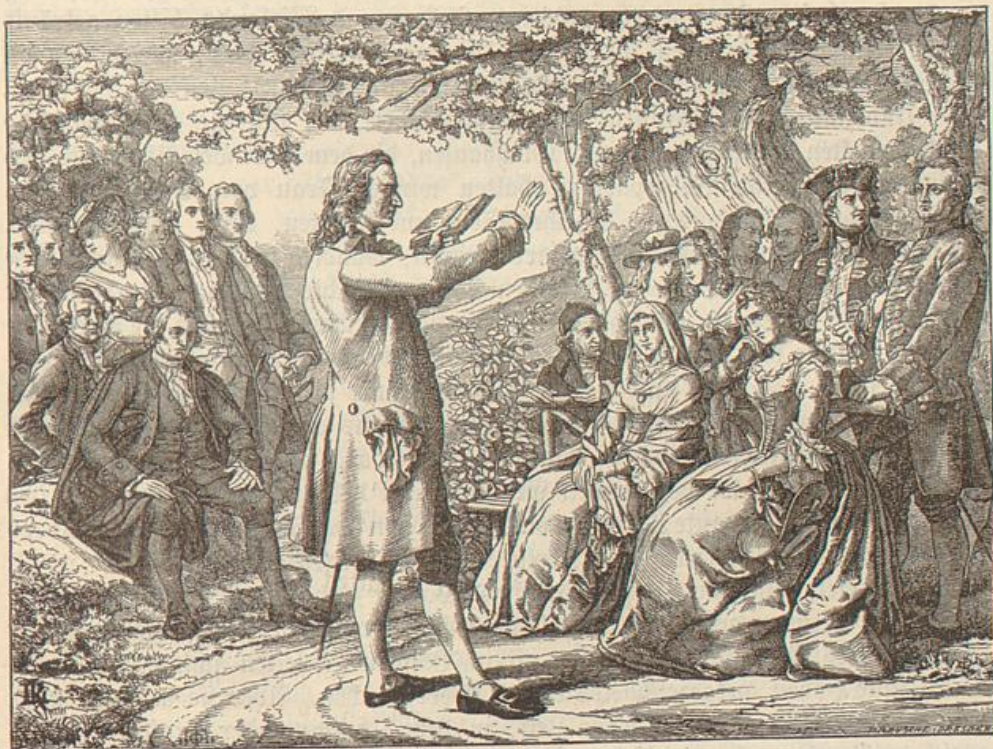
Am Musenhof von Weimar. Nach von Der. (Vgl. S. 369—370.)

besonders tritt diese Humanität als Herzensfülle hervor, wie man sie ja empfinden muß, wenn man sich in eine Welt von lauter Brüdern gestellt sieht. Es ist Nächstenliebe, Bruderliebe, was ihn beherrscht, ohne alles kirchliche oder konfessionelle Gepräge, aber mit dem Drange zu geben, zu helfen, zu beglücken, und mit dem Bewußtsein, daß er es vermag. So bildete sich um Goethe ein Sphäre liebevollen Empfindens und Thuns, eine Sphäre, in der auch seine Phantasie zur Geltung kam, ebenso wie umgekehrt in dem Reiche der Phantasie, in seiner Dichtung, sein Leben sich zur Darstellung brachte. Er lebte Poesie und dichtete Lebenswirklichkeit, Poesie und Leben sind nie so eins gewesen wie in Goethe.