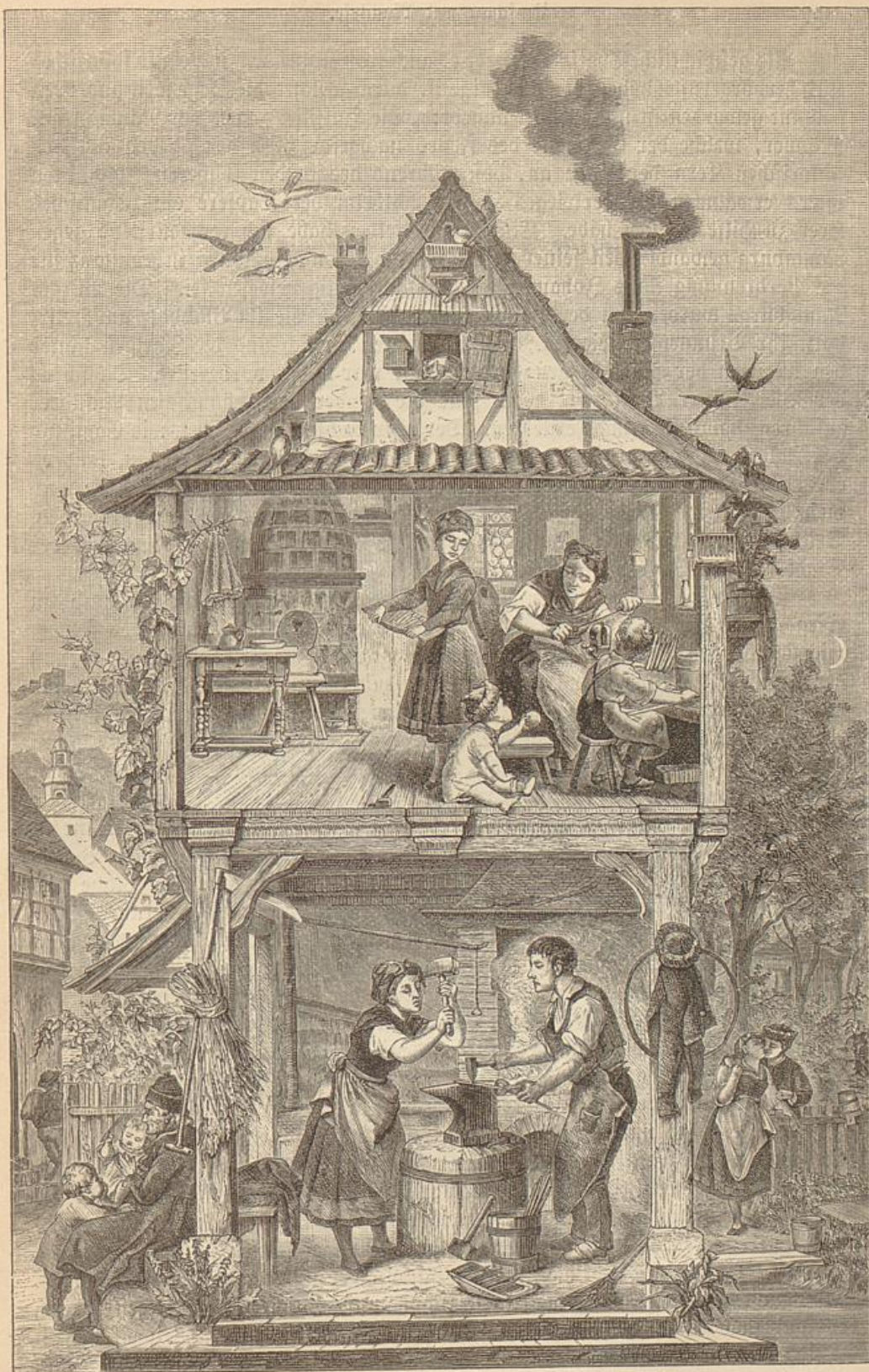
Aus den thüringer Schmiededörfern.