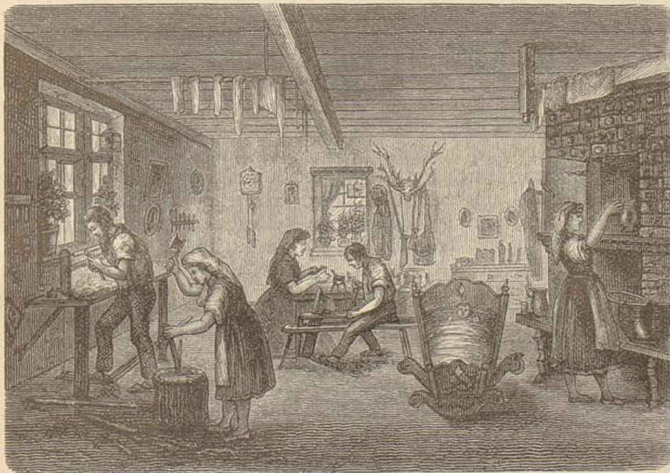
Spielwarenwerkstätte in Thüringen.

Und so ist es denn schwer, den thüringer Volkscharakter zu bezeichnen. Was ich mich über ihn zu sagen getraue, betrachte ich nur als ein Ergebnis der oben skizzierten Geschichte des Volkes. Eine gewisse Virtuosität des Umgangs mit Menschen oder, allgemeiner gefaßt: eine Fähigkeit, sowohl den Menschen als auch den Verhältnissen gerecht zu werden, ist dem Thüringer eigen. Die Lage des Landes und der mannigfache Wandel und Wechsel in seiner Geschichte mag ihm das eingetragen haben.