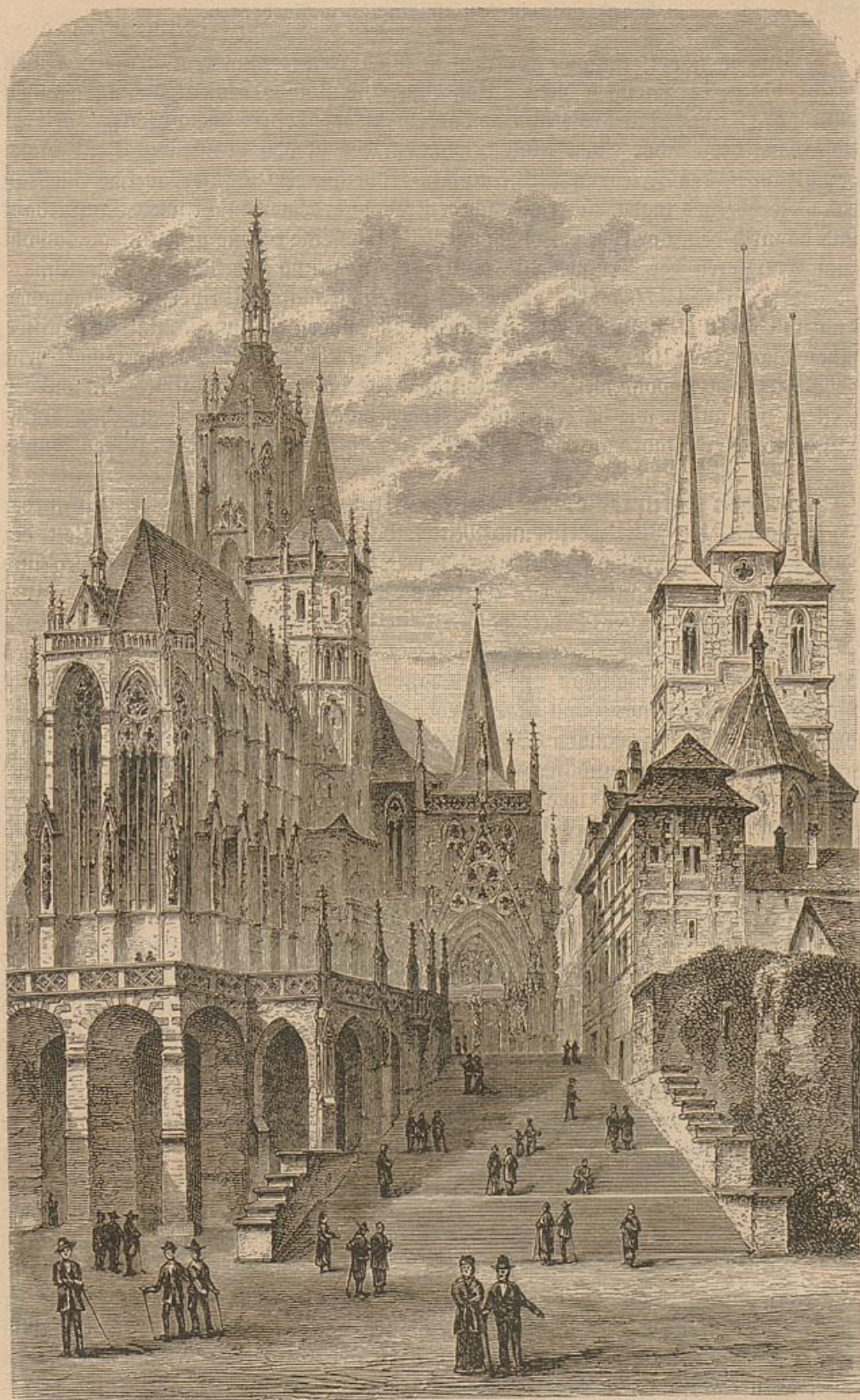
Der Dom zu Erfurt.