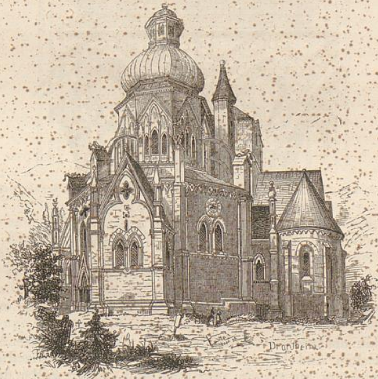
Oestliche Ansicht des Domes zu Drönheim. (Nach v. Minutoli.)

(dem „Hundszahn“ der Engländer), mäanderartigen Zinnen u. dgl. Innen sind die Wände dieser Arkaden mit gebrochenbogigen Arkaden geschmückt, denen sich eine reiche Ornamentik, hier in den Formen reinsten Classicität, zugesellt. — Ein andres Stück phantastischer Pracht ist die Arkadenwand, welche den Zugang vom Chor-Mittelschiff in das Octogon ausmacht. Zwei der Hauptpfeiler seines Mittelraumes (in breiterem Abstände als an dessen übrigen Seiten) zählen zu den Gliedern dieser Wand; aber anderweitige Arkaden, zum Theil mit übermässig schlanken Stützen, oberwärts offne Gallerieen, Ornamentfüllungen, sculpturengeschmückte Bogenöffnungen treten hinzu, dem Ganzen den Anschein der reichsten Lettner-Architektur gebend. Indess ist dies einer der Theile des Baues, wo sich den frühgothischen Formen entschieden spätgothische einmischen, der Art, dass hier eine durchgreifende Ueberarbeitung der ursprünglichen Anlage wird angenommen werden müssen. — Das Aeussere des Octogons ist nicht