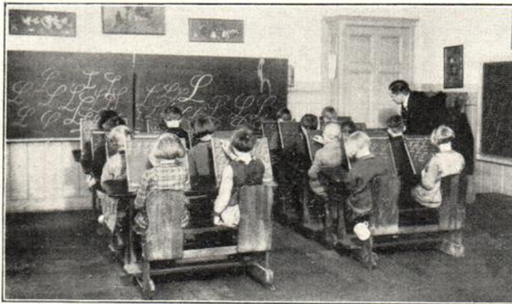
Aus der Sehschwachen-Schule: Schreib-Lese-Unterricht.

In der Sehschwachenschule werden die Kinder vereinigt, deren Sehkraft so geschwächt oder herabgesetzt ist, daß sie dem Unterricht in der Normalschule nicht oder nur unter Überanstrengung der Augen folgen können. Einer angepaßten Behandlung gelingt es, sie ohne Schädigung ihrer schwachen Sehkraft zu den Zielen der Normalschule zu führen. Die besondere Aufgabe der Sehschwachenschule besteht