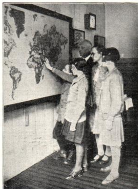
Erdkunde in der Sehschwachen-Schule.

Zurückversetzt nach der Normalschule wurden 1925/26 aus den 4 Schwerhörigenschulen im engeren Berlin von 269 Kindern 7, 1926/27 von 283 Kindern 4 Kinder.