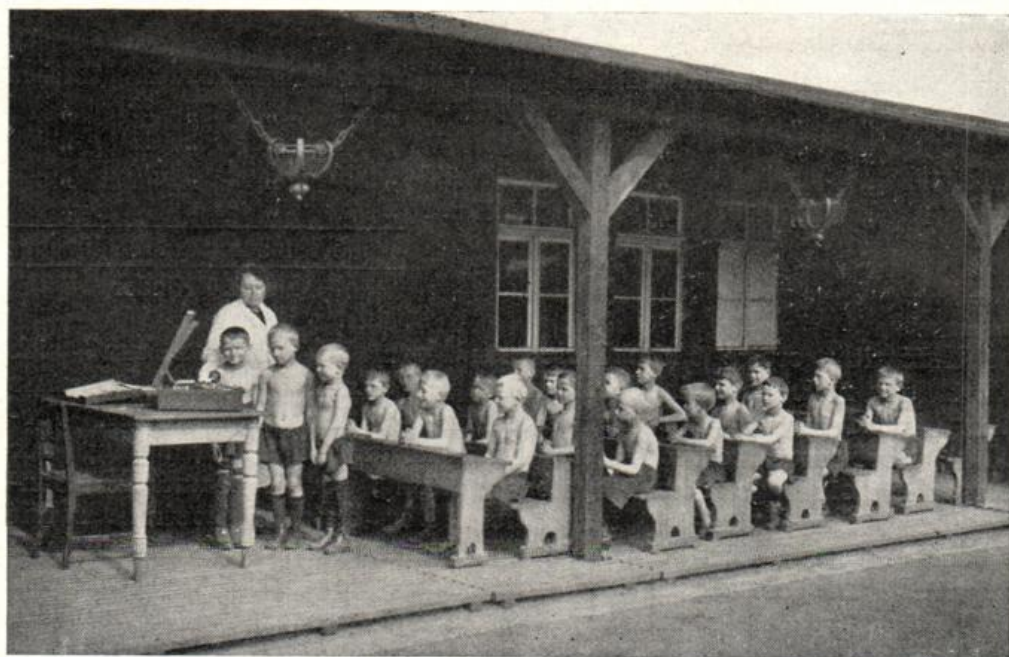
Freiluftschule für tuberkulöse Kinder.