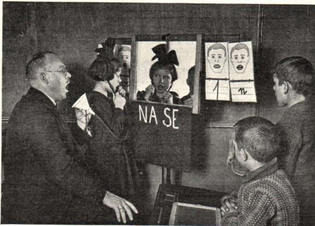
Artikulations-Übung unter Benutzung eines Spiegels. Sprachheil-Schule in Berlin-Neukölln.