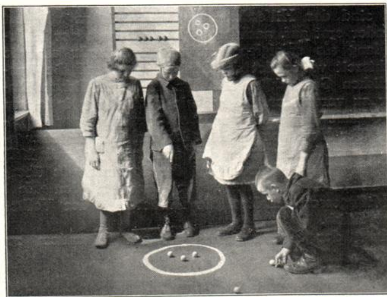
Anstalt für Epileptische in Wuhlgarten. Lernen im Spiel: Auffüllen der 5. (Das eine Mädchen trägt eine gepolsterte Kappe zum Schutz bei plötzlichen Anfällen.)

schen Auffassungen entsprechende Lehrpläne aufgestellt. In der Wittenauer Heilstättenschule wird ferner die nachgeahmte Familien-erziehung unter Mitwirkung des Lehrerkollegiums erstrebt, in der Wuhlgartener Anstaltsschule für Epileptische der Ausbau des Fortbildungsunterrichts für die Jugendlichen. Die Wittenauer Anstalt zählte: