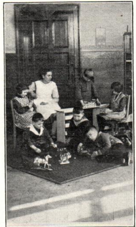
Spiel im Kindergarten.

Die Schulpflicht kann nach Auffassung der Aufsichtsbehörde auf die Schulkindergärten nicht ausgedehnt werden. Es könnte dies geschehen, wenn man nicht Schulkindergärten einrichtete, sondern Klassen, und diese nicht Schulkindergärtnerinnen, sondern Lehrkräften übertrüge. Da es zweifelhaft erscheint, ob dann die Schulkindergärten ihren spezifischen Charakter aufrecht erhalten können, ist von der Durchführung dieses Gedankens Abstand genommen worden. Die Einrichtung erfreut sich bei den Eltern