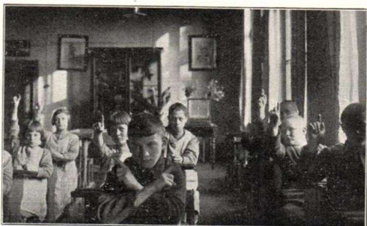
Anstalt für Epileptische in Wuhlgarten. Ausscheiden eines Schülers vom Unterricht. Anzeichen der Beklemmung durch den Schüler vorn.

Nur bei 34 Kindern (17 Knaben und 17 Mädchen) wurde der Ausschluß von dem Normalschulunterricht als unbedingt notwendig bezeichnet, doch sträubten sich die Eltern von 23 dieser Kinder gegen die Überweisung in die Anstalt, zum Teil der Kosten wegen, die für den Unterhalt erhoben werden müssen.