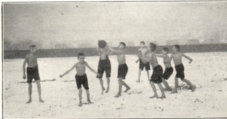
Freiluftschule für tuberkulöse Kinder.

c) Aus Anlaß des Krüppelfürsorgegesetzes vom 6. Mai 1920 ist der Einzelunterricht als unentgeltlicher Pflichtunterricht auf alle nicht schulfähigen Krüppelkinder ausgedehnt worden. Bei Bekanntwerden des Gesetzes waren die meisten dieser Krüppelkinder durch den