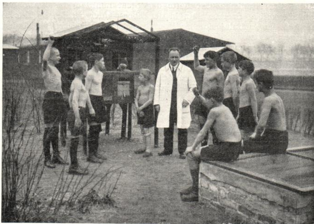
Im Schulgarten der Freiluftschule für tuberkulöse Kinder.