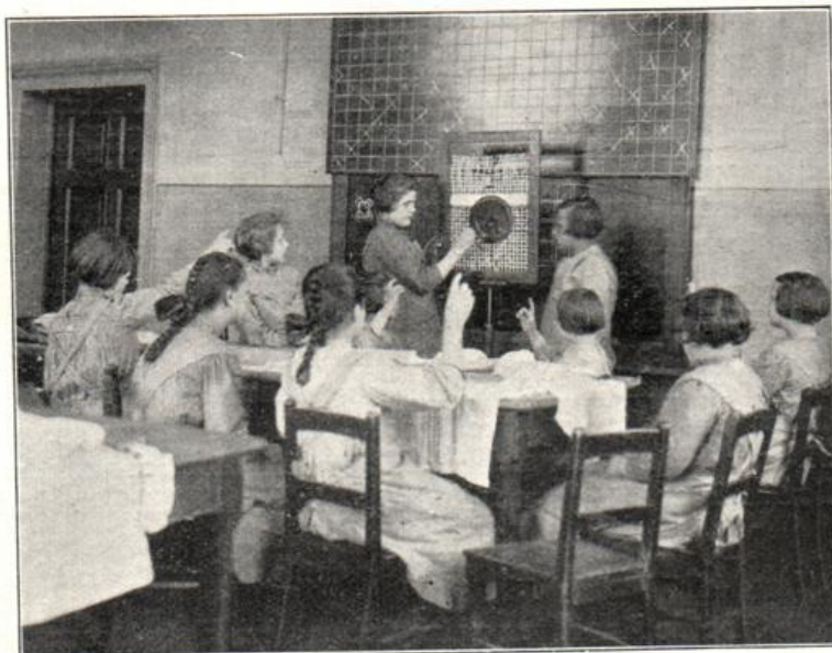
Anstalt für Epileptische in Wuhlgarten. Sinnfällige Vorführung: Übung im Knopfnähen.

Während man annehmen kann, daß in den Hilfschulen und der Wittenauer Anstalt sämtliche noch bildungsfähigen geistig schwachen Kinder vereinigt sind, in der letzteren besonders die Waisen und erziehlich und pfleglich unzureichend Versorgten, umfaßt die Wuhlgartener Anstalt keineswegs alle epileptischen Kinder.