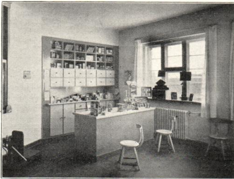
Kaufmannsladen in der Hilfsschule Spandau.

mäßige Feststellungen zu machen. In den Jahren 1916 bis 1924 schwankten die jährlichen Rückversetzungen aus der Hilfs- nach der Normalschule zwischen 4 und 7 Kindern. 1925 wurden aus den 20 Hilfsschulen im engeren Berlin von 3273 Kindern 10, 1926/27 von 3134 Kindern ebenfalls 10 zurückversetzt.