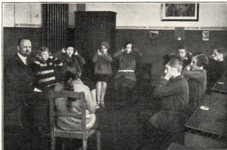
Schwerhörigen-Schule: Natürliche Schalleitung.

müssen. Die Schulbehörde beabsichtigt darum, sobald die hinreichende Schülerzahl vorhanden sein wird, ein 9. freiwilliges Schuljahr mit weiterführenden Zielen für begabte schwerhörige Kinder einer der bestehenden Schwerhörigenschulen anzuschließen und diesen Kindern damit den Weg in den Erwerb und eine ihren Anlagen angepaßte Tätigkeit zu erleichtern.