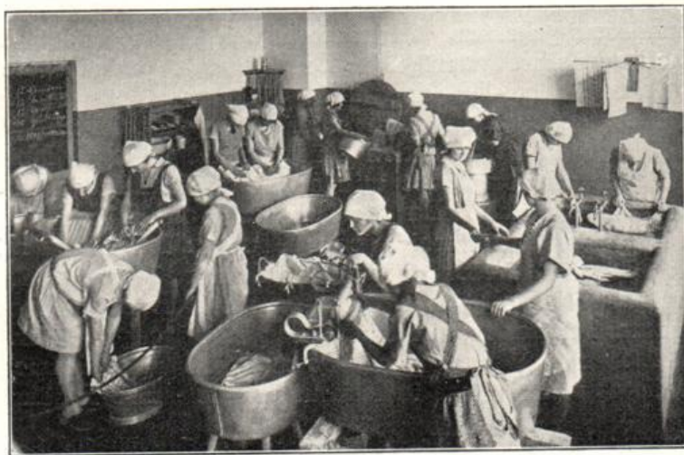
Unterricht im Waschen in der Berufsschule Berlin-Wilmersdorf.

Die Einrichtung der Waschküche und des Zimmers für Hausarbeit zeigt, daß auch raue Arbeit in zweckentsprechenden Arbeitsstätten von unseren Schülerinnen freudig verrichtet wird. Beim Be-