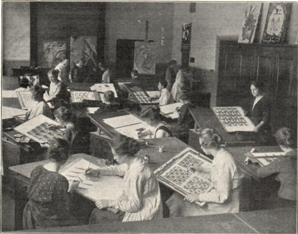
Städt. Höhere Fachschule für Textil- und Bekleidungsindustrie

4. Die erhöhten Anforderungen, die die Mode in Industrie und Handwerk an die schaffenden Künstler stellt, hatten dazu geführt, daß nicht nur an der Textil- und Konfektionsschule ein umfangreicher Unterricht auf diesem Gebiet geschaffen wurde, auch die beiden Kunstgewerbeschulen übernehmen die Pflege dieses Zweiges des Kunstgewerbes. Als daher die Fachorganisationen mit der Bitte um Errichtung einer höheren Fachschule für die Modeindustrie an die Stadtverwaltung herantraten, wurde nach längeren Erwägungen der Errich-