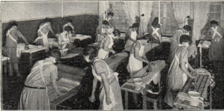
Plättklasse der Berufsschule in Berlin-Wilmersdorf.

treten der Waschküche hört man lustiges Geklapper der Holzpantoffeln der fleißigen Wäscherinnen, die an 5 großen Zinkwannen eifrig waschen oder bei dem Abkochen der Wäsche in den zwei großen eingemauerten Kupferkesseln am roten Backsteinherd tätig sind. Eine andere Gruppe bedient eine mit Gas geheizte Waschmaschine. Ein freistehender, zweiseitiger Spülzuber mit Zuleitungsrohren für kaltes und warmes Wasser wird eben zur Aufnahme der fertig gekochten Wäsche mit Wasser gefüllt. An den Wänden sehen wir heruntergeklappte Wandtische zum Einseifen der Wäsche, damit sie außer Dienst bei der Enge des Raumes die Bewegungsfreiheit der Schülerinnen nicht hemmen.