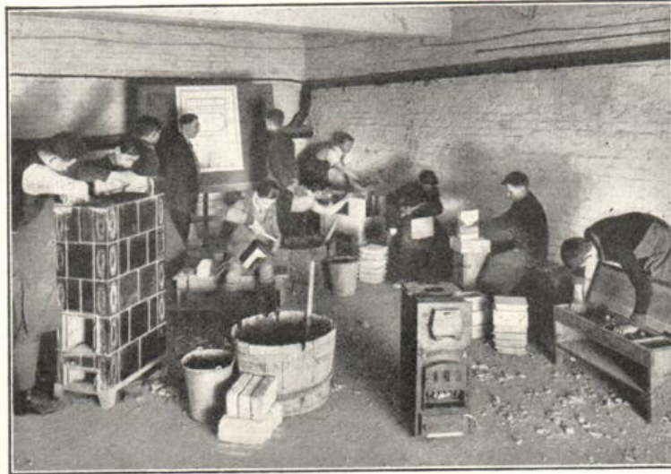
Praktische Übungen für Töpfer

Verwaltungsmäßig erfordert die Schaffung und der Ausbau von Demonstrations- und Übungswerkstätten für die Gesamtheit der Schulen noch viel Arbeit und erhebliche Geldmittel. Hierbei handelt es sich nicht bloß um einmalige, sondern um laufende Aufwendungen. Wenn die Demonstrations- und Übungswerkstätten ihren Zweck erfüllen sollen, so müssen sie dem Stande der rastlos vorwärtstrebenden Technik angepaßt sein.