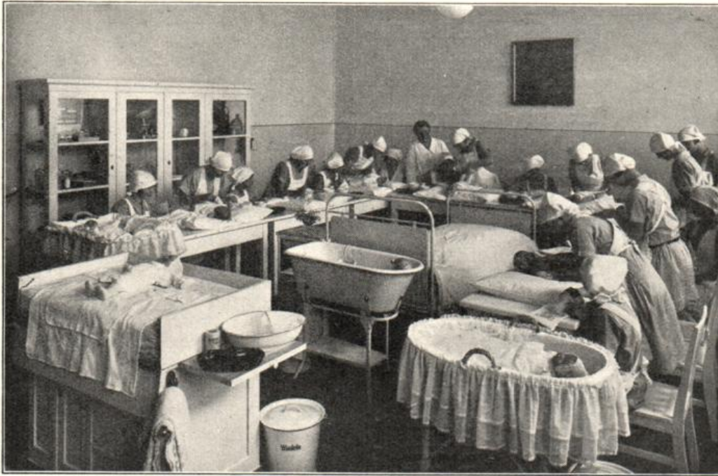
Unterricht in der Kranken- und Säuglingspflege in der Berufsschule in Berlin-Wilmersdorf

wirtschaftlichen Fächern nachholen. Zu diesem Zweck werden in fast allen Mädchenberufsschulen wahlfreie Lehrgänge im Schneidern, Wäscheanfertigen, Plätten und Kochen abgehalten. Bei dem niedrigen Schulgeld ist die Teilnahme an diesen Lehrgängen in den späten Nachmittagsstunden und abends sehr rege.