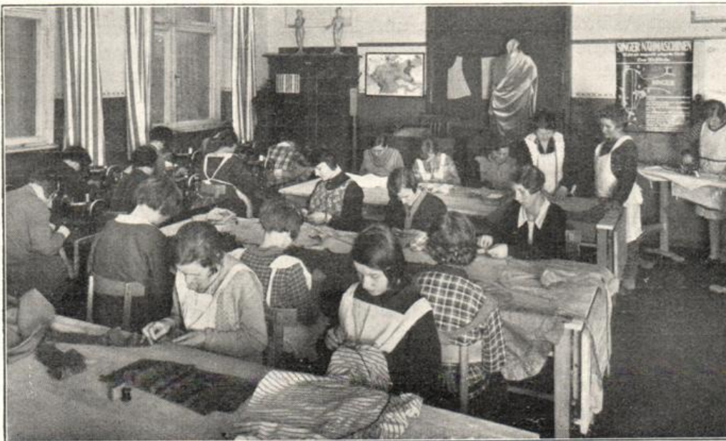
Unterricht im Wäschenähen und Schneidern in der Berufsschule Berlin-Wilmersdorf.

Ein sorgfältig verschließbarer Trockenboden steht für die ordnungsmäßige Aufnahme der Wäsche zur Verfügung. In der nächsten