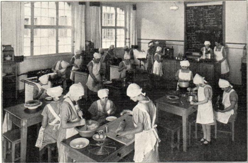
Kochunterricht an der Berufsschule Berlin-Wilmersdorf.

ausgestatteten Raume, der zwischen beiden Küchen liegt, zur Ruhe, Hier finden sie Gelegenheit, sich im Decken der Tafel und im Servieren der Mahlzeit zu üben.