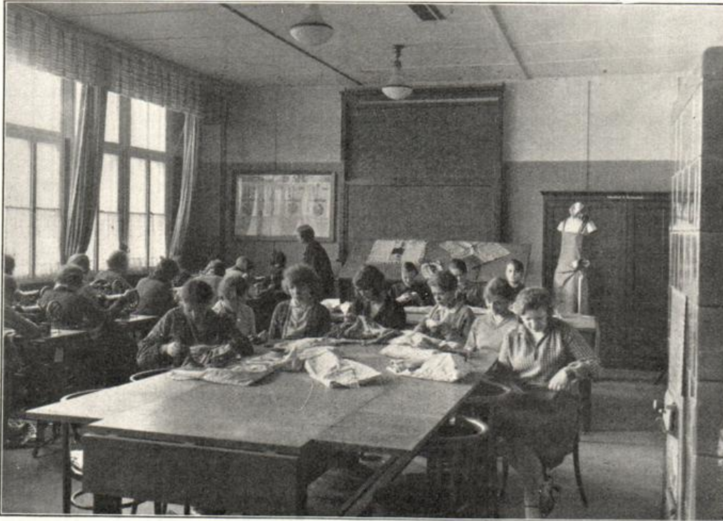
Nadelarbeitsunterricht in der Berufsschulbaracke Berlin-Cöpenick

im Bezirk Neukölln eine Berufsschule für Mädchen und eine kaufmännische Berufs-, Handels- und höhere Handelsschule für Jünglinge und Mädchen, im Bezirk Cöpenick eine Berufsschule, im Bezirk Lichtenberg je eine Berufsschule für Jünglinge und Mädchen, im Bezirk Weißensee eine Berufsschule und im Bezirk Pankow eine Berufsschule.