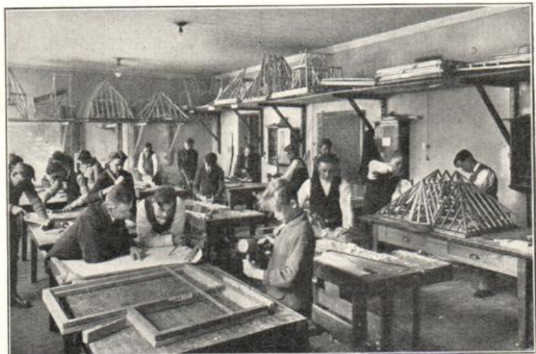
Praktische Übungen für Zimmerer

Das Bestreben der Verwaltung ist es daher, beide Schulen in eine innige Verbindung zu bringen. Räumlich ist dies über-