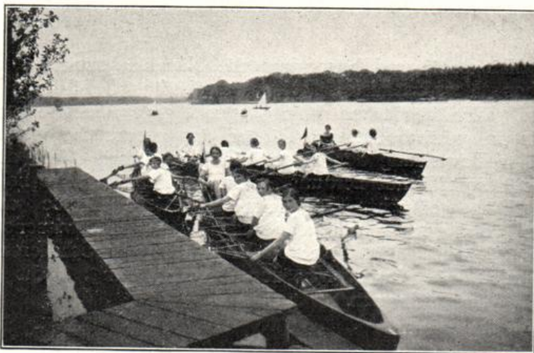
Die Ruderriege legt an.

Auch die körperliche Ausbildung kommt in den Handels- und Höheren Handelsschulen nicht zu kurz. Turnen ist Pflichtfach mit