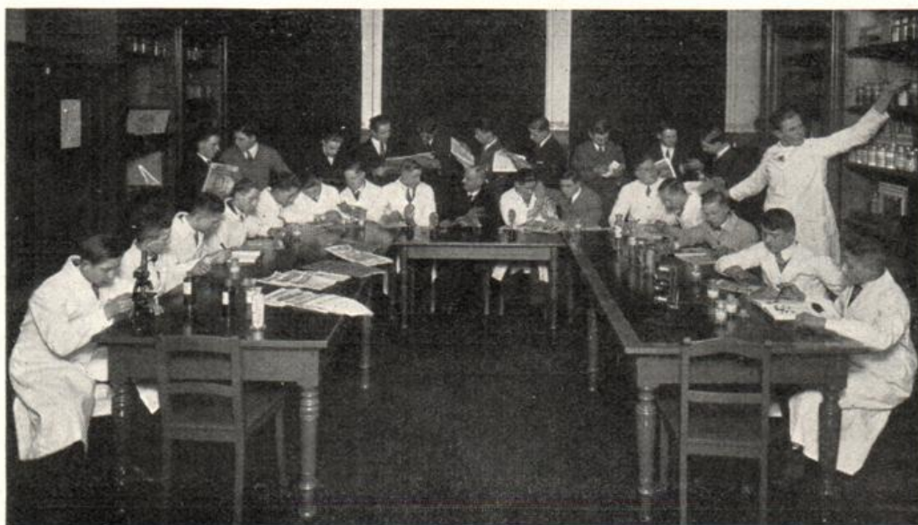
Kaufmännische Berufsschule für Jünglinge Warenkunde in der Lebensmittelhändlerklasse nach der Arbeitsschulmethode.

Dafür wurde diese Schule völlig von den Textilkaufleuten ent-