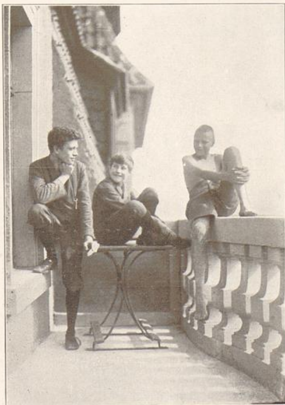
Plauderstunde (H. B. — W. Ph. — A. Sch.)