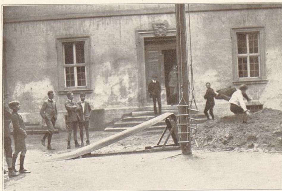
Sprungübungen auf dem Hofe des L. E. H. Bieberstein