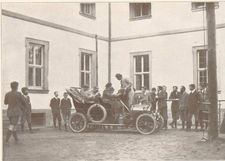
Aufbruch von Bieberstein zum Besuch der anderen Heime