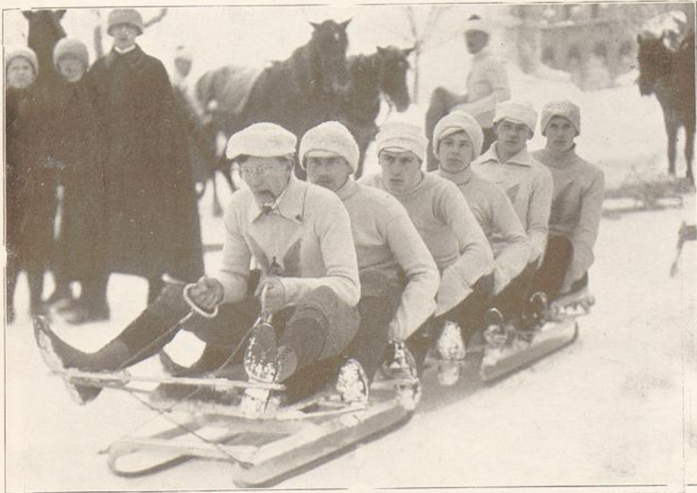
Beim Bobsleigh-Rennen in Oberhof