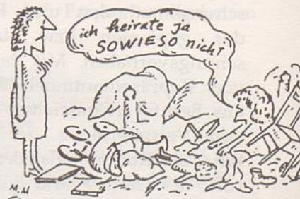
Illustration: Mane Marcks