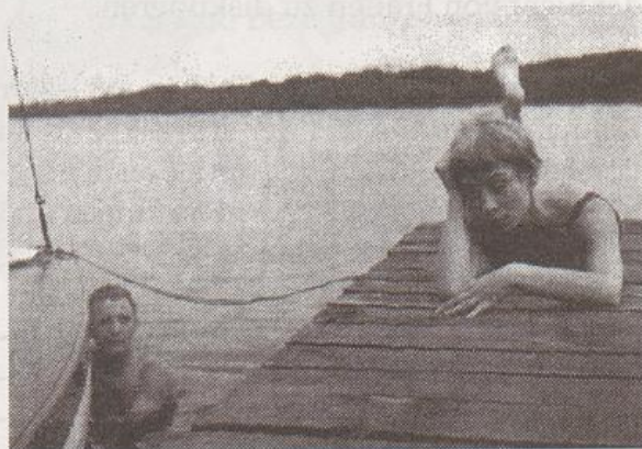
Jutta Hoffmann als Karla und Jürgen Hentsch als Kaspar in „Karla“ (1965)

Das genaue Programm könnt ihr den Aushängen entnehmen. Unsere Filme sind für alle offen.