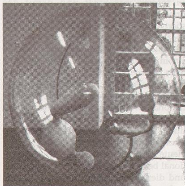
Hohlwelt , 1996

der sich zwei Elemente vertrauter Form befinden, die den häuslichen Bereich suggerieren (ein Stuhl und eine Lampe), sowie ein drittes Element, dessen Form undefinierbar und amorph ist. Das amorphe Element, das sich in diesen fast autistisch zu nennenden Raum „eingeschlichen“ hat, verleiht dem Werk ein ambivalentes Oszillieren zwischen Schützendem und Beängstigendem.