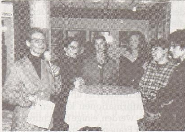
Talkrunde mit Absolventinnen der Universität-GH Paderborn

zeigt, Diskriminierungserfahrungen berichtet, Motivationen zur Berufswahl dargelegt, sowie die Problematik der Vereinbarkeit mit Beruf und Kindererziehung angesprochen und Tips zur Karriereplanung gegeben.