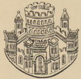
Goldbulle Friedrichs I. (gebraucht 1152–1180)

Grabschrift des Abtes Avo nach Msc. I. 251, S. 297.