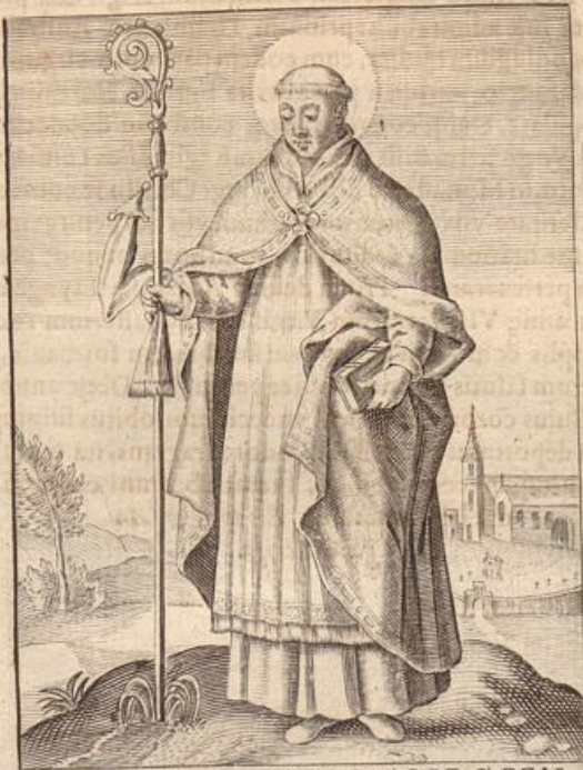
S. ENGELMVNDVS ABBAS ORD. S. BEN.

Hic natione Anglus diuino instinctu in Kenenariam circa an- num DCC. fidem inuexit; Velsa proce Harienuum, aquam pre- cibus de terra produxit. obiit XXI Junij, miraculis etiam fulgoris.