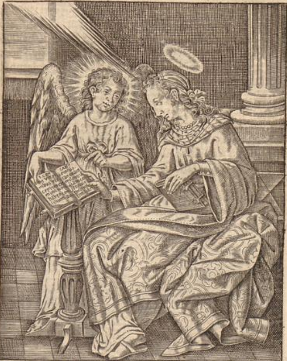
S. EDILDREDA REGINA ET VIRGO, ORDINIS S. BENEDICTI.

Hac primam Tumberto, deinde Egferdo Regi nupsit, cum octog. virginitate. illibatam servavit: demum Sanctimonialis & Abbatissa obiit XXIII Idij. An. DCXC. Eius coepus post XI annos incorruptum est repositum. JGM