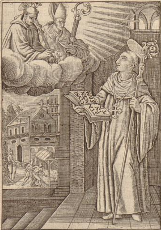
S. ODO ABBAS CLUNIACENSIS. Canonia odo, Abbas. vnus hys mille reformat; Praescribens sacris artia statuta vni.

Tuto. i agn. ietate. pressu su per. s distri. modem ois pau. a locut censu s. tate Sa. , deuo. praci. im sibi His ac. e quo. quentes ncipum mandis erravit, ri rede. ces