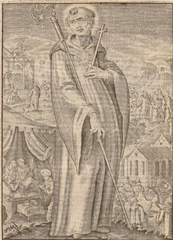
S. COLVMBANVS ABBAS ORD. S. BEN, Ipse COLVMBANVS Stoicis duresus ab opis. Tot legitur varijs Claustra locasse locis.